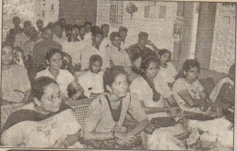
இல. 15, சிறாம்பியடி ஒழுங்குகளில் அமைந்துள்ள எம்.எம்.ஐ.சி ஊடகப் பயிற்சி நிறுவனத்தில் பயிற்சி பெறுபவர்களில் ஒரு தொகுதியினர்.

கேள்வி :- எம்.எம்.ஐ.சி. நிறுவனம் இலங்கையில் ஆரம்பிக்கப்பட்டதன் நோக்கம் என்னவென்று கூறுவீர்களா?