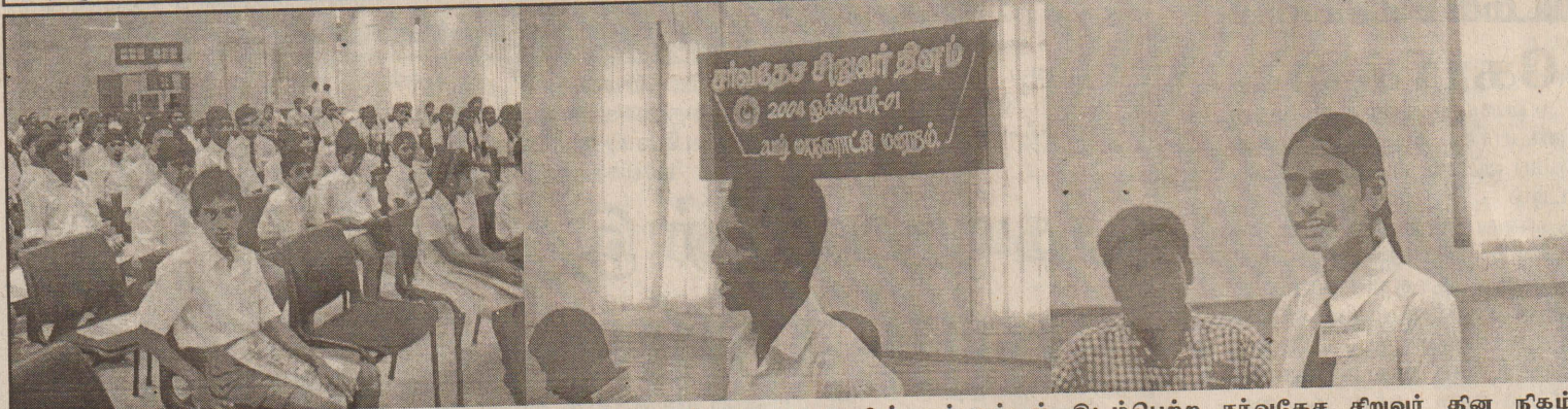
யாழ்ப்பாண பொது நூலகக் கேட்போர் கூடத்தில் யாழ்.மாநகரசபையின் ஏற்பாட்டில் இடம்பெற்ற சர்வதேச சிறுவர் தின நிகழ்வில் கலந்துகொண்டவர்களையும், சிறுவர்கள் தமது திறமைகளை வெளிப்படுத்துவதையும் படங்களில் காணலாம்.