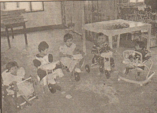
தமிழர் புனர்வாழ்வு நிறுவனமும், வடக்கு, கீழ்க்கு மாகாண முன்பள்ளி கல்வி மேம்பாட்டு நிலையமும் இணைந்து நல்லை திருஞானசம்பந்தர் ஆதீன மண்டபத்தில் நடத்திய சிறுவர்தின நிகழ்வில் இடம்பெற்ற சிறுவர்களின் நிகழ்வையும், இந்நிகழ்வில் கலந்துகொண்டவர்களையும் படங்களில் காணலாம்.