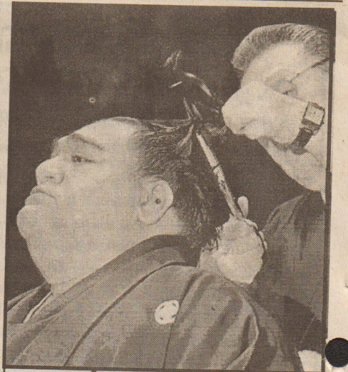
சமோ மல்யுத்தப் போட்டிகளில் இருந்து ஓய்வு பெறும் சமோ மல் யுத்த சம்பியன் முசாஷிமரு கண் ணீர்மல்க தனது தலை முடிகளை வெட்டிக் கொள்வதைப் படத்தில் காணலாம்

நேற்றுமுன்தினம் பொலிஸாரிடம் கலைப் பொருள்களை விட்டுவிட்டுத் தப்பியோடிய திருட்டுக் கும்பல்தான் இப்படுகொலையைச் செய்திருக்கலாம் என பொலிஸார் சந்தேகிக்கின்றனர். (ப)