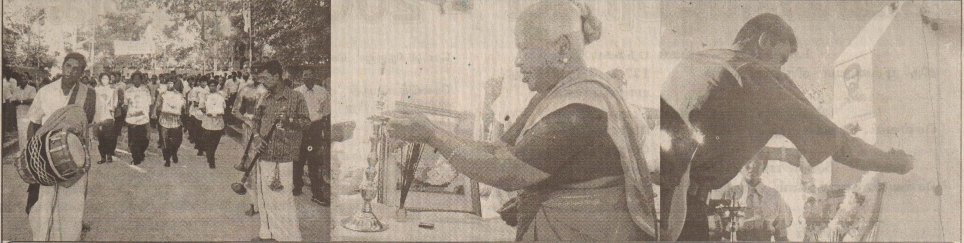
நேற்று திருவில்லி, நடைபெற்ற குமரப்பா, புலேந்திரன் உட்பட்ட பன்னிரு வேங்கைகளின் நினைவுதின நிகழ்வுகளின்போது எடுக்கப்பட்ட படங்கள்.