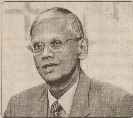
அடிப்படையிலோ சமாதானப் பேச்சுவார்த்தைகள் முன்னெடுக்கப்படும் பட்சத்தில் நாம் அதனை முழுமையாக ஆதரிப்போம் என்று ஜனாதிபதியிடம் பலமுறை நாம் தெரிவித்துள்ளோம் எனவும் சுட்டிக்காட்டினார். (ந-8)

இடைக்கால நிர்வாகத்தின் அடிப்படையிலோ, ஒஸ்லோ உடன்படிக்கையின்