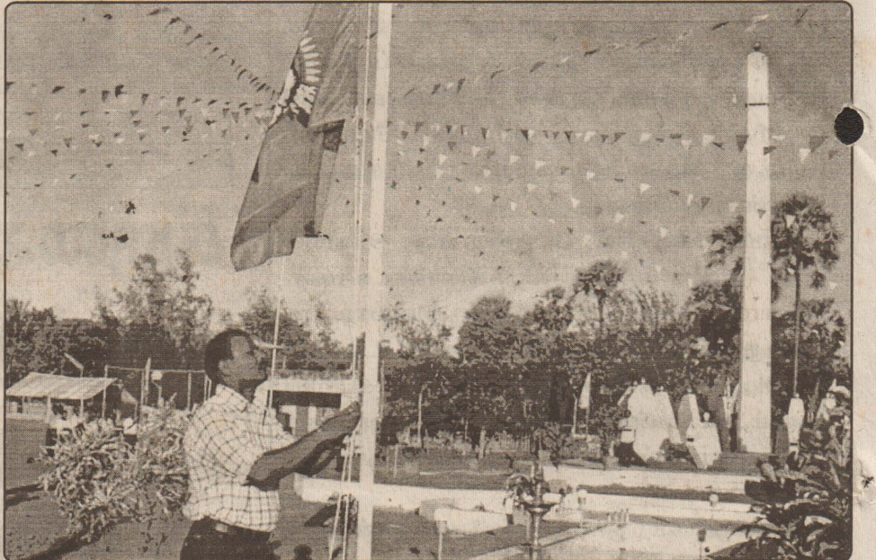
தீருவில் நடைபெற்ற பன்னிரு வேங்கைகளின் நினைவு நிகழ்வில் தமிழீழத் தேசியக் கொடியினை ஏற்றுவதைப் பட்டத்தில் காணலாம்.

5 இழுவைப் படகுகளில் மீன்பிடித்துக் கொண்டிருந்த இவர்களை இலங்கைக் கடற்படையினரின் ரோந்துப் பிரிவினர் கைதுசெய்து தலைமன்னார் பொலிஸாரிடம் ஒப்படைத்துள்ளார்கள். இந்த மீனவர்கள் நேற்று மாலை மன்னார் மாவட்ட நீதிமன்றத்தில் ஆஜர்படுத்தப்பட்டு, எதிர்வரும் 19 ஆம் திகதிவரை விளக்கமறியலில் வைக்கப்பட்டுள்ளார்கள். (ச)