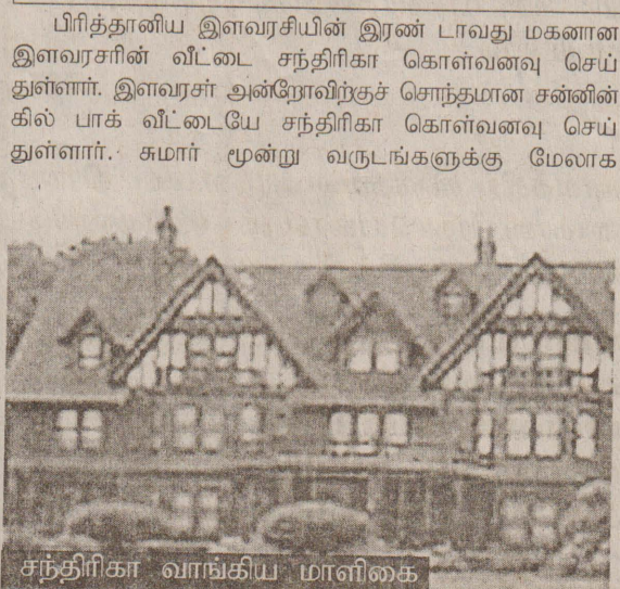
சந்திரிகா வாங்கிய மாளிகை

— குடும்ப உறவினர் பெயரில் 300 ஆயிரம் மில்.பவுண்ட் வைப்பு