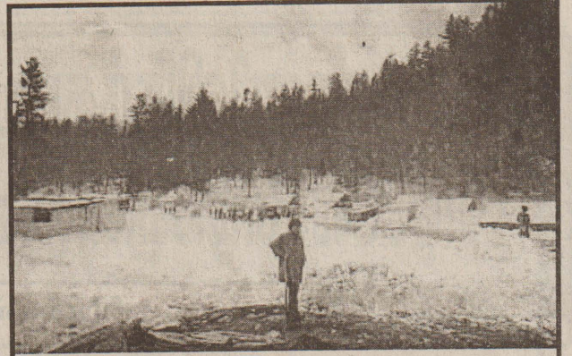
காஷ்மீரில் பூகம்பத்தால் பாதிக்கப்பட்ட திராங் யாரிப் பகுதியில் மக்கள் தற்காலிகக் கூடாரங்களில் தங்கியுள்ளனர். அங்கு கிடும் பனிப்பொழிவினால் கூடாரங்களைச் சுற்றிப் பனிக்குவியல் கள் கொட்டிக்கிடக்கின்றன.

அமெரிக்க இராணுவமும் ஈராக் படைகளும் அந்நிய நாட்டு தீவிரவாதிகள் குறித்து மிகுந்த கவலை அடைந்துள்ளன. அதனாலேயே இந்தத் தடை விதிக்கப்பட்டுள்ளது எனத் தெரிகிறது.