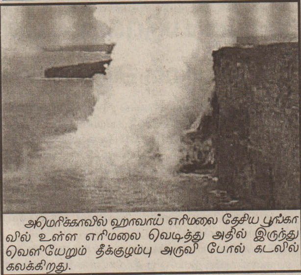
அமெரிக்காவில் ஹாவாய் எரிமலை தேசிய பூங்காவில் உள்ள எரிமலை வெடித்து அதில் இருந்து வெளியேறும் தீக்கழம்பு அருவி போல் கடலில் கலக்கிறது.