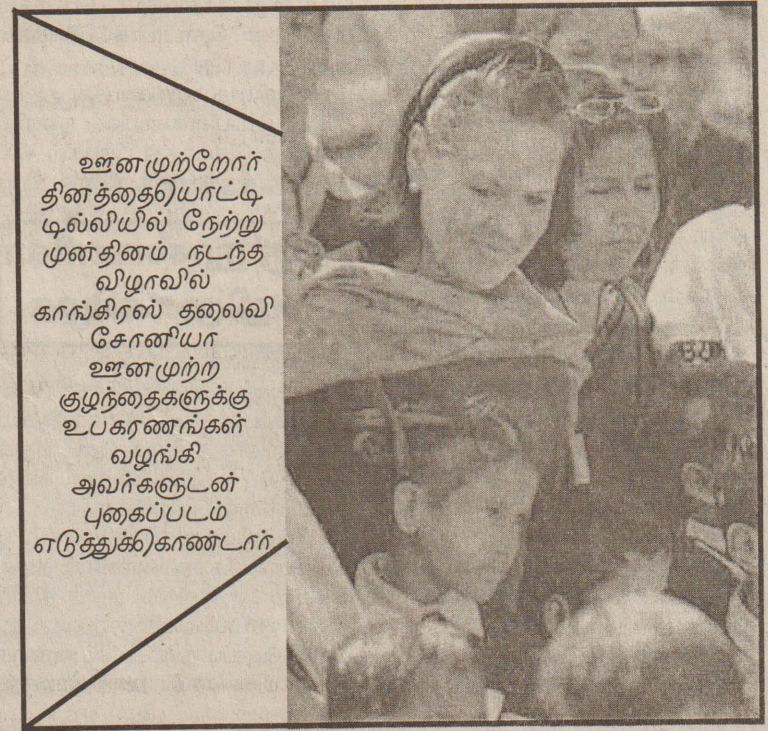
ஊனமுற்றோர் தினத்தையொட்டி டில்லியில் நேற்று முன்தினம் நடந்த விழாவில் காங்கிரஸ் தலைவி சோனியா ஊனமுற்ற குழந்தைகளுக்கு உபகரணங்கள் வழங்கி அவர்களுடன் புகைப்படம் எடுத்துக்கொண்டார்