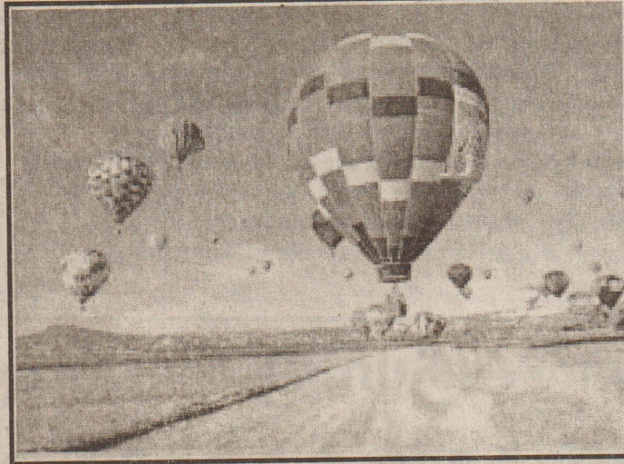
மெக்சிக்கோவில் உள்ள லியோன் நகரத்தில் நான்காவது சர்வதேச பல்லுன் பரகூட் விழா கொண்டாடப்பட்டு இதை முன்னிட்டு நடந்த விழாவில் கலந்துகொண்டவர்கள் கலர் பரகூட்டில் தங்கள் பயணத்தைத் தொடங்கினார்கள்

சுதந்திரமாகச் செயற்படக்கூடிய ஒரு நீதித்துறை இல்லாமல் இந்த வழக்கத்தைக் கட்டுப்படுத்த முடியாதென்றும் அந்த அதிகாரி மேலும் கூறினார்.