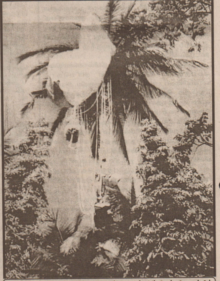
விபத்துக்குள்ளாகி வீழ்ந்த விமானப்படை யின் கபீர் ஜெட் விமானத்தின் விமானி பரகூட் முலம் குகித்தபோது, குளியாப்பிட்டிய நக்காவத்தையில் தென்னைமரம் ஒன்றில் அவரது பரகூட் சிக்கியது. பொதுமக்களின் உதவியுடன் அவர் மீட்கப்பட்டார். பரகூட் தென்னையில் சிக்கியிருப்பதைப் படத்தில் காணலாம்.