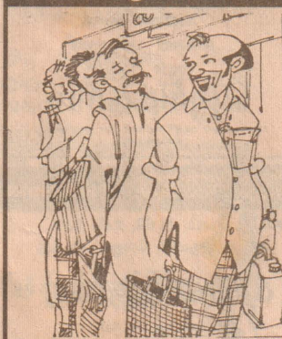
தமிழ் சிப்ப எவிரெவருக்கெல்லாம் அவசியமாய்ந்துது பார்த்தியே...