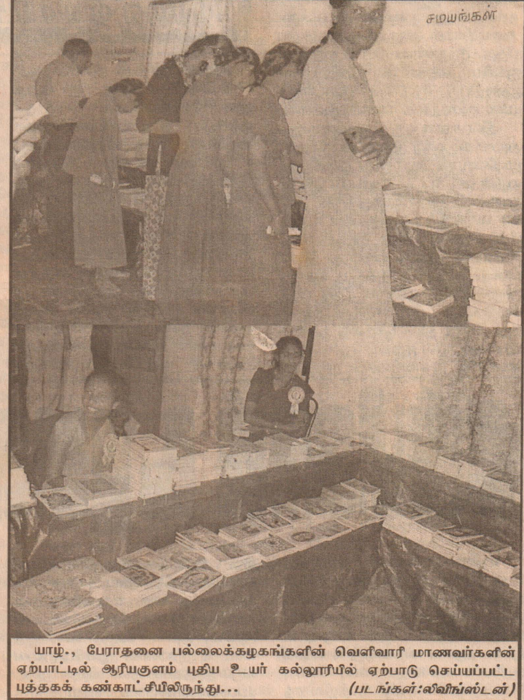
யாழ்., பேராதனை பல்கலைக்கழகங்களின் வெளிவாரி மாணவர்களின் ஏற்பாட்டில் ஆரியகுளம் புதிய உயர் கல்லூரியில் ஏற்பாடு செய்யப்பட்ட புத்தகக் கண்காட்சியிலிருந்து...

ஜே.வி.பி. மற்றும் அரசு சார்பு மாணவர்கள் மத்தியில் இடம்பெற்ற இம்மோதல்களில் அறு மாணவர்கள் படுகாயமடைந்ததும் பல்கலைக்கழகச் சொத்துக்கள் சேதமுற்றதும் தெரிந்ததே. இதனால் பல்கலைக்கழக கல்வியை நிறுத்திவைப்பதற்கான நடவடிக்கைகள் மேற்கொள்ளப்பட்டுள்ளது.