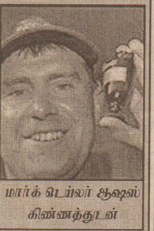
மார்க் பெய்லர் ஆஷஸ் கிண்ணத்துடன்

1882 -83 ஆஷஸ் தொடரில் விருவிருப்பான ஒரு டெஸ்ட் ஆட்டத்தில் இங்கிலாந்திலேயே, இங்கிலாந்து அணி அவுஸ்திரேலியா விடம் மண்கல்வியது. இதனைப் பொறுக்க முடியாத இங்கிலாந்து ரசிகர்கள் "1882 ஆகஸ்ட் 29ல் ஒவல் மைதானத்தில் மரணித்த ஆங்கிலேய கிரிக்கெட்டினை நண்பர்கள் நினைவு கூர்கின்றோம். உடல் தகனம் செய்யப்பட்டு சாம்பல் அவுஸ்திரேலியாவிற்குக் கொண்டு செல்லப்படும்" என்று ஒரு மரண அறிவித்தலைப் பத்திரிகையில் பிரசுரித்தார்கள். 1882-83இல் இங்கிலாந்து, அவுஸ்திரேலியா சென்று 2 டெஸ்ட் போட்டிகளில் வென்றபோது மெல்போரன் பெண்மணிகள்