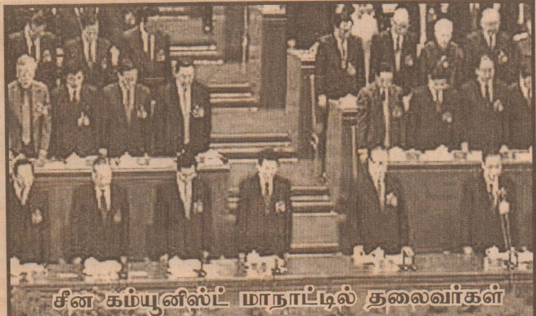
சீன கம்யூனிஸ்ட் மாநாட்டில் தலைவர்கள்

எதிர்காலத்தில் கையாள்வது பற்றி சிந்திக்கப்படுவதாகவும் அவர் குறிப்பிட்டுள்ளார்.