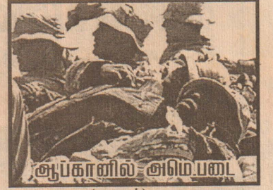
ஆப்கானில் அமெரிக்க ஹெலிகளின் தாக்குதல்