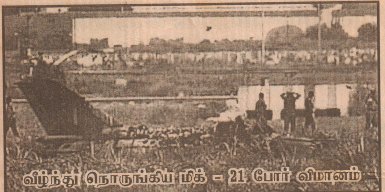
வீழ்ந்து நொருங்கிய மிக - 21 போர் விமானம்

(புதுடில்லி) இந்திய விமானப்படை தன் வசமுள்ள சோவியத் தயாரிப்பு மிக-21 ரக போர் விமானங்களை கைவிடத் தீர்மானித்துள்ளது. இந்த ரக போர் விமானங்களில் 250 விமானங்கள் 1991 முதல் நடைபெற்ற விபத்துக்களில் சம்பந்தப்பட்டுள்ளன. இந்த விபத்துக்களில் 100 விமானங்களும் உயிரிழந்திருக்கின்றன. மோசமான பாதுகாப்பு உபகர