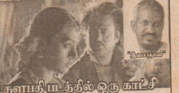
தளபதி படத்தில் ஒரு காட்சி

எஸ்.பி.பாலசுப்பிரமணியம், சுவர்ணலதா ஆகியோர் பாடிய இப்படலுக்கு இளையராஜா இசையமைத்திருந்தார். பி.பி.ஸி உலக சேவை இணையத்தளம் நடத்திய கருத்துக் கணிப்பில் இந்த முடிவுகள் எடுக்கப்பட்டுள்ளன. இரண்டாவது இடத்தை 1997ல் வெளியான கிளிவ் ரிச்சர்டின் "நாம் இனிப் பேசப்போவதில்லை" (We dont talk anymore) என்ற பாடலும் மூன்றாம் இடத்தை 1998ல் செயர் பாடிய Believe என்ற பாடலும் பெற்றுள்ளது. இக் கருத்துக் கணிப்பீட்டிலிருந்து பி.பி.ஸி இணையத்தளத்தின் கருத்துக் கணிப்பில், இந்திய மக்களே அதிகமாகப் பங்குகொண்டு தமது வாக்குகளை இந்தியப்பாடலுக்கு அளித்துள்ளனர் எனத் தெரிவிக்கப்படுகின்றது.