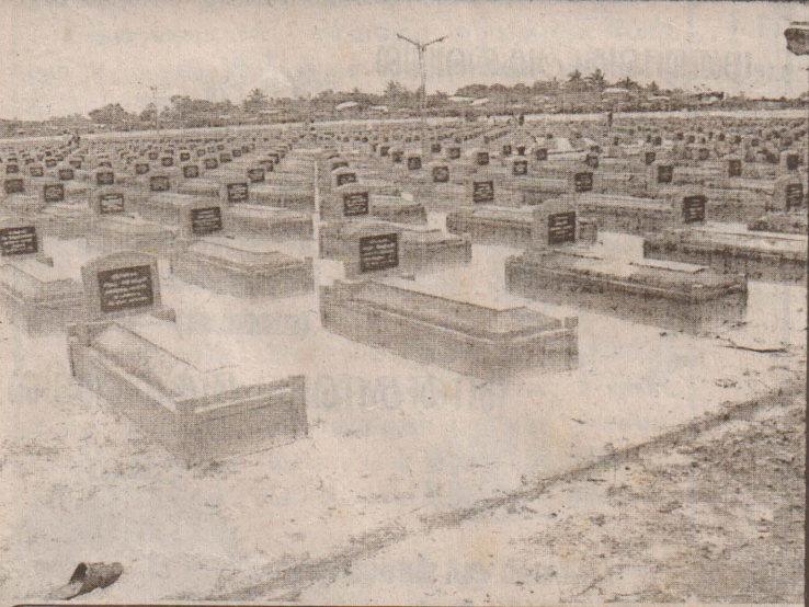
புத்தாக அமைக்கப்பட்டுள்ள மாவீரர்களின் கல்லறைகள்.