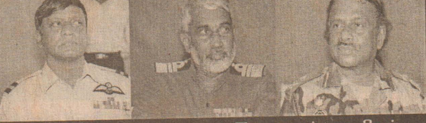
விமானப்படை, கடற்படை, இராணுவத் தளபதிகள்

தேசிய பாதுகாப்புச் சபையும், பாதுகாப்புச்சபையும் சில