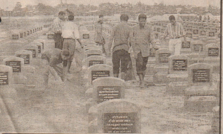
துயிலும் இல்லத்தில் நேற்று சீரமைப்பணியில் ஈடுபட்ட பல்கலைக்கழக மாணவர்களையும் படங்களில் காணலாம்.