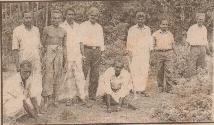
தெல்லிப்பளை பனை, தென்னைவள அபிவிருத்தி கூட்டுறவு சமாசம், சிறிபால்கரன் விளையாட்டரங்கில் மேற்கொண்ட பணம் விதை நடுகையைப் படத்தில் காணலாம்.

யும் அந்தத் தேசிய இனத்திற்குரியது. ஒரு கட்சிக்கு மக்களின் ஆதரவு இருக்கிறதோ இல்லையோ அதன் செயற்பாட்டை முடக்க ஒருவருக் கும் அதிகாரம் கிடையாது. சமாதானம், தமிழ் மக்களின் அபிலாஷை என்பன தமிழ் மக்கள் மத்தியில் ஜனநாயகம், மனித உரிமை என்பவற்றையும் உள்ளடக் கியதே. ஒவ்வொரு தனிமனிதனும் உரிமைகள் பாதுகாக்கப்பட வேண் டும். இங்கு சமூக நிறுவனங்கள் தவறான வழியில் செயற்பட நிர்ப் பந்திக்கப்படுகின்றன. உலகம் ஒரு கிராமமாக மாறிக்கொண்டிருக்கும் இன்றைய சூழ்நிலையில் சமூகத்தின் பல்வேறு தரப்பினரையும் உரிமைகள் வலியுறுத்தப்படும் காலகட்டத்தில் இத்த கைய நிலைமைகளை சர்வதேச சமூகம் அனுமதிக்க முடியாது என்பதை தயவுடன் சுட்டிக்காட்ட விரும்புகிறோம் என்றுள்ளது.