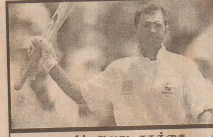
தனது 14 ஆவது சதத்தை அடித்த மகிழ்ச்சியில் பொன்டிங்

அடிவெயிட்டில் நடைபெறும் ஆஷஸ் கிண்ணப் போட்டியின் இரண்டாவது டெஸ்டின் மூன்றாம் நாள் ஆட்ட முடிவில் எஸ்கோர் விபரம் இங்கிலாந்து: 342 & 36-3 ஆஷஸ்ரேலியா: 552-9