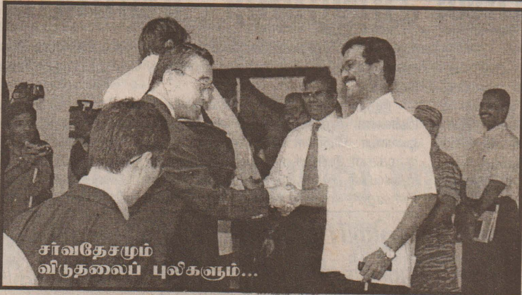
சர்வதேசமும் விடுதலைப் புலிகளும்...

நாடாளுமன்றத்தில் 2003ஆம் ஆண்டிற்கான வரவு-செலவுத் திட்டம் சமர்ப்பிக்கப்பட்டுள்ளது. ஒதுக்கீடுகள் தொடர்பான விவாதங்கள் இடம் பெறுகின்றன. மறுபுறத்தில் தமிழீழ விடுதலைப் புலிகளும் அரசாங்கமும், சம அந்தஸ்தில் சர்வதேச சமூகத்தின் மத்தியில் பேச்சுவார்த்தைகளை நடத்திக் கொண்டு இருக்கின்றனர். இதற்கிடையில் ரணிலின் தலைமையிலான ஐக்கிய தேசிய முன்னணி அரசாங்கத்திற்கு எதிர்க்கட்சிகளால் பல்வேறு இடையூறுகள் மற்றும் சவால்கள் கொடுக்கப்பட்டுக்கொண்டிருக்கின்றன.