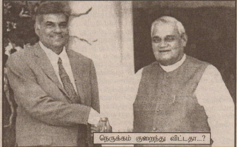
நெருக்கம் குறைந்து விட்டதா...?

இதற்கைய திட்டமிடலைப் பாகிஸ்தான் போன்று உடனடியாக இலங்கையில் ஏற்படுத்திக்கொள்ள முடியாத நிலை காணப்பட்டது. அது