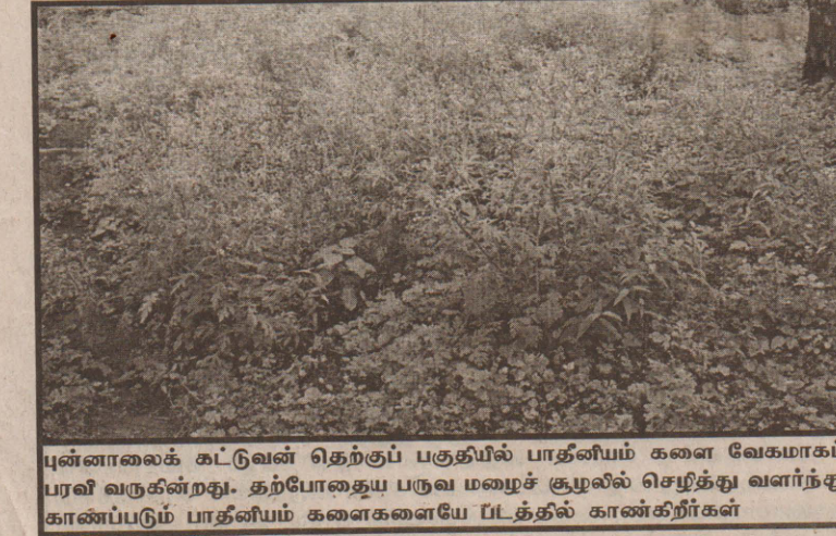
புன்னாலைக் கட்டுவன் தெற்குப் பகுதியில் பாதுகாப்புக் களை வேகமாகப் பரவி வருகின்றது. தற்போதைய பருவ மழைச் சூழலில் செழித்து வளர்ந்து காணப்படும் பாதுகாப்புக் களைகளையே பட்டத்தில் காண்கிறீர்கள்

ஆனால் மேற்படி தாக்குதல் சம்பவத்துடன் இந்த இளைஞர்கள் சம்பந்தப்பட்டதாக பொலிஸாரினால் நிரூபிக்க முடியாததால் மட்டக்களப்பு மேல் நீதிமன்றம் இருவரையும் விடுவிக்க உத்தரவிட்டுள்ளது.