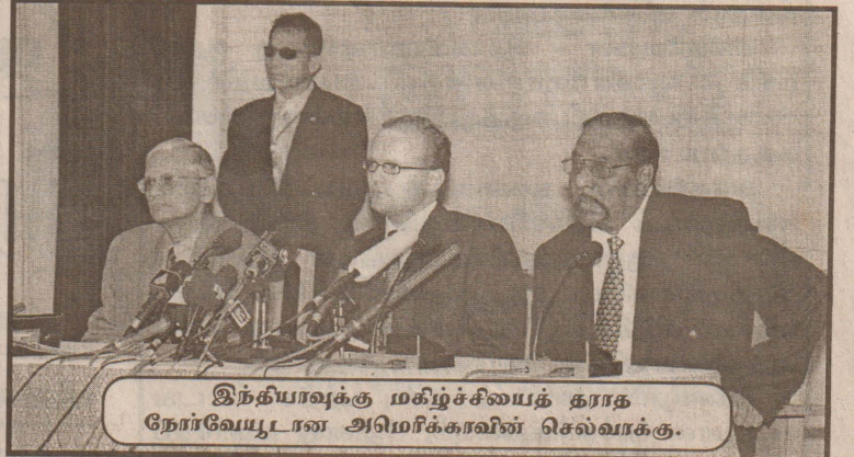
இந்தியாவுக்கு மகிழ்ச்சியைத் தராத நோர்வேயுடனான அமெரிக்காவின் செல்வாக்கு.

எனவே தன் கையை விட்டுப் பிரிந்து செல்லும் - இலங்கை இனப் பிரச்சினைக்கான மேலதிகாரத் தன்மை, இந்தியாவுக்கு விருப்பத்தைத் தராது மட்டுமல்ல, அமெரிக்காவின் செல்வாக்கு இலங்கை இனப் பிரச்சினை விவகாரத்தில் அதிகமாகவும் - இந்தியாவைப் பொறுத்தமட்டில் முக்கியமான விடயங்களேயாகும். எது எப்படியிருந்தாலும் இந்தியா இவ்வாறான பின்னடைவுகளைத் தவிர்க்க தொடர்ந்தும் ஏதாவது