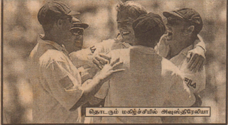
தொடரும் மகிழ்ச்சியில் அவஸ்திரேலியா

ஆஷஸ் கிண்ண டெஸ்ட் கிரிக்கெட் இங்கிலாந்து அணியினர் மீண்டும் மோசமான நிலையில்