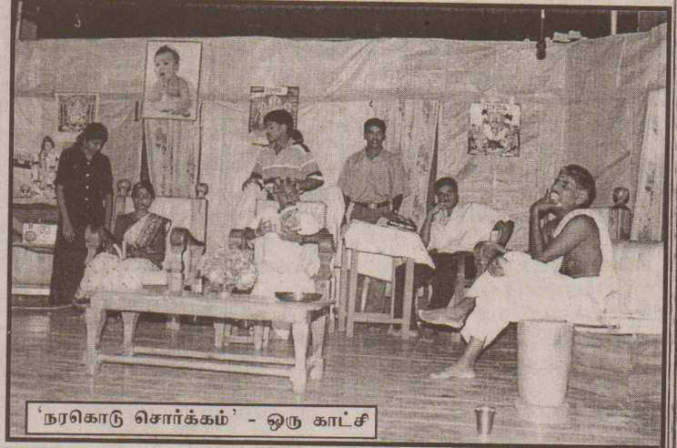
'நரகொடு சொர்க்கம்' - ஒரு காட்சி

பயணத்துக்கு முதல், கி.பி எண் டால் கிளாலிப் பயணத்துக்குப் பிறகு!" என்னும் மகேசனின் வசனமும் இதற்கு நல்ல எடுத்துக் காட்டு! நெறியாளர் நிறையப் பாடு