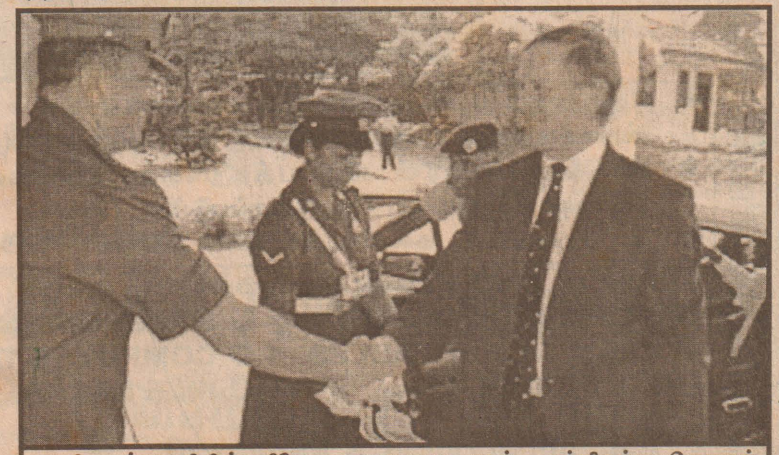
பிரதமர் ரணில் விசேட தூதுவராக யாழ்ப்பாணம் வந்திருந்த ஜெனரல் சேர்.மைக்கல் ரோஸ் கொழும்பில் இராணுவத் தலைமையகத்தில் உயர்படை அதிகாரியால் வரவேற்கப்படும் காட்சி.