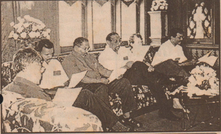
இன்றைய பேச்சுக்களில் கலந்துகொள்ளும் புலிகள் தரப்புப் பிரதிநிதிகள் குழு.

மலர் : 01 திருவள்ளூர் ஆண்டு: 2033 கார்த்திகை 16 ஆம் நாள், ஹிஜ்ரி 1423 றமழான் 26 (02.12.2002) திங்கட்கிழமை இதழ் : 62