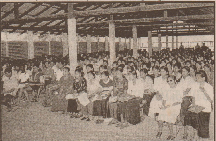
கன்னாகம் ரோட்டிற்கு கழகத்தினால் நடத்தப்பட்ட க.பொ.த சாதாரண வழிகாட்டல் கருத்தரங்கில் பங்கு பற்றிய மாணவர்களில் ஒரு பகுதியினரை மேலே உள்ள படத்தில் காணலாம். (72)

படையினரால் அகற்றப்பட்டுள்ளது குறிப்பிடத்தக்கது. பொதுமக்கள் பாவனைக்கு இந்த மயானம் திறந்து விடப்படாமல் இருப்பது குறித்து 'நமது ஈழநாடு' செய்தி வெளியிட்டதன் தொடர்ச்சியாகவே இது மக்கள் பாவனைக்கு திறந்து விடப்பட்டுள்ளது.