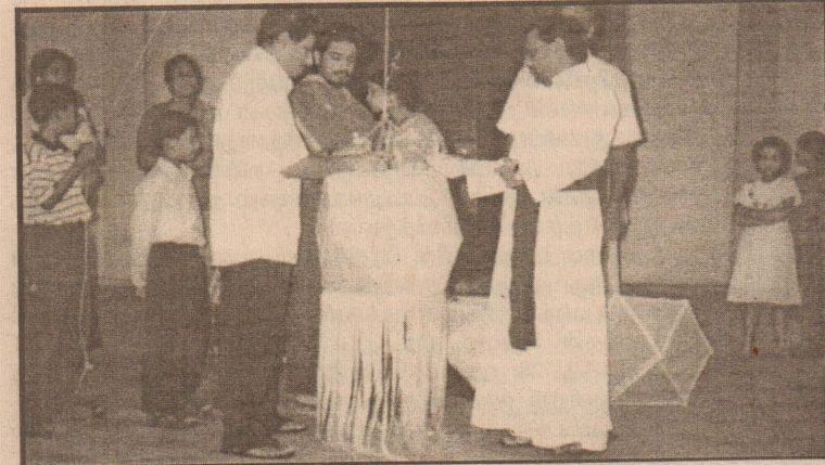
நாவற்குழி உயிர்ப்பூட்டல்குழுவின சமாதான ஒளியேற்றல் நகழ்வில் - இந்நகழ்வெழுத்துச் சஞ்சிகைப் போட்டிகளை விரிவுபடுத்தக் கல்வி அமைச்சு நடவடிக்கைகளை மேற்கொண்டு வருகின்றது. தாய்மொழிக் கல்வியுடன் இணைந்து அமுல்படுத்தும் திட்டங்கள் தயாரிக்கப்படுவதாகவும், கடந்த காலங்களைப் போலல்லாது மாணவர்களின் ஆர்வத்தை அதிகளவில் தூண்டும் திட்டமாகப் புதிய கல்விச் சீர்திருத்தப் பாடத்துடன், இத்திட்டம் அமுல்படுத்தப்படவுள்ளது. (96)

(வவுனியா நிருபர்) புதுவை அன்பின் தயாரிப்பான 'கனவுகள்' தெருவெளி நாடகம் மன்னாரில் பரவலாக அரங்கேற்றப்பட்டு வருகின்றது.