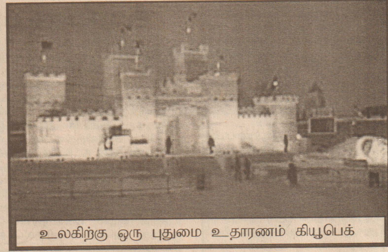
உலகிற்கு ஒரு புதுமை உதாரணம் கியூபெக்

அடுத்ததாக - ஐக்கிய நாடுகள் சபை வரையறுத்த சுயநிர்ணயம், அனைத்தரிமைகளும் கியூபெக்கியர்