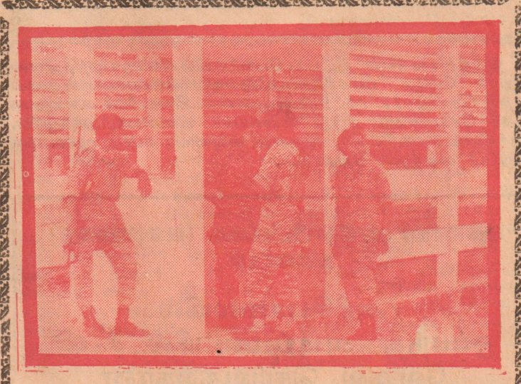
பெண் போராளிகளுடன் ஒரு சந்திப்பு உள்ளே.... 6-ம் பக்கத்தில்

போதனாகிரியர்கள் சேர்க்கப்பட்ட போதும் தேவைக் கேற்றதாக நிறைவு செய்யப்படவில்லை. தற்போது நடைபெற்று வரும் பயிற்சி நெறி களுக்கு - 8ஆம் பக்கம் பார்க்க