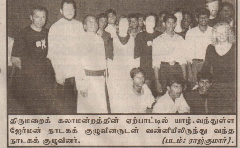
திருமறைக் கலாமன்றத்தின் ஏற்பாட்டில் யாழ்.வந்துள்ள ஜேர்மன் நாடகக் குழுவினருடன் வன்னியிலிருந்து வந்த நாடகக் குழுவினர். (படம்: ராஜ்குமார்).

கிய நாங்கள் இக்கொலையினைச் செய்தவர்களைக் கண்டுபிடிப்பதற்கு நடவடிக்கை எடுத்துள்ளோம். தமிழ், முஸ்லிம் ஒற்றுமையினைப் பேணுவோம், நாட்டிலுள்ள அமைதி நிலைக்கு வலுச்சேர்ப்போம் எனத் தெரிவிக்கப்பட்டுள்ளது.