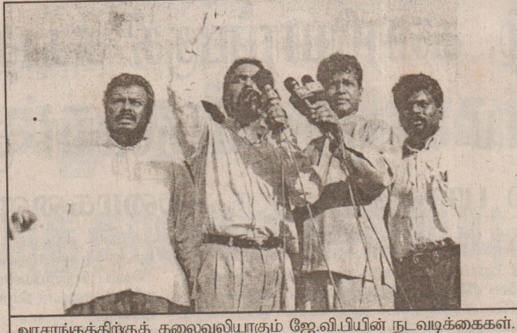
அரசாங்கத்திற்குத் தலைவலியாகும் ஜே.வி.பி.யின் நடவடிக்கைகள்.

மேற்கொண்டார். வழமையாக ஜனாதிபதியின் நாட்டு மக்களுக்கான உரையைக் காட்டிலும், பிரதமரின் உரைக்கு எதிர்பார்ப்பு அதிகரித்திருந்தது. கடந்த காலத்தில் முக்கியமான தருணங்களில் கூட ஜனாதிபதி நாட்டு மக்களுக்கு உரையாற்றிய வேளையில் அதில் எவ்வித நம்பிக்கைகளும் அல்லது தீர்மானங்களும் மேற்கொள்ளப்படவில்லை என்பது தெளிவான விடயமாகும்.