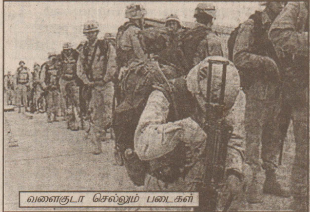
வளைகுடா செல்லும் படைகள்

ஸ்வீல்ட் கையெழுத்திட்டுள்ளார். இப்படைகளில் ஆரம்பக்கட்டத்