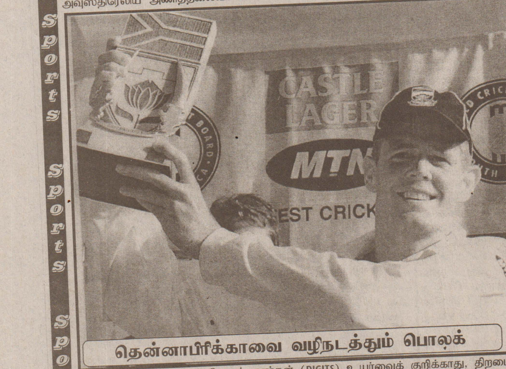
தென்னாபிரிக்காவை வழிநடத்தும் பொலக்

தை மாதம் ஐந்தாம் திகதி ICC தனது டெஸ்ட் ஆட்டத் தரவரிசைப்படுத்தலை அறிவித்துள்ளது. இதன் அடிப்படையில் இதுவரை காலமும் டெஸ்ட் தரவரிசையில் முதலிடம் பெற்றிருந்த அவுஸ்திரேலியா இண்டாம் இத்திற்குத் தள்ளப்பட, தென்னாபிரிக்கா முதலாம் இடத்தைப் பெற்றுக்கொண்டுள்ளது. பாகிஸ்தான் - தென்னாபிரிக்கா இண்டாவது முதலாம் இடத்தைப் பெற்றுக்கொண்டுள்ளது. இடத்தில் மெதுமெதுவாக முன்னேறி தரவரிசைப்படி இந்த முடிவு அறிவிக்கப்பட்டுள்ளது. இதில் மெதுமெதுவாக முன்னேறி நியூசிலாந்து அணி மூன்றாவது இடத்தைப் பெற்றிருப்பது சிறப்பாகச் சுட்டிக்காட்டப் பட்டதக்கது. நியூசிலாந்து அணியைத் தொடர்ந்து இலங்கை, இங்கிலாந்து, இந்தியா, இந்தத் மேற்கிந்தியத் தீவுகள், பாகிஸ்தான், சிம்பாவே என்று தரவரிசை முடிவடைகிறது. இந்தத் தரவரிசை முறையானது 1996 மே மாதத்தில் இருந்து கணிக்கப்பட ஆரம்பிக்கப் பட்டிருக்கின்றது. இந்தத் தரவரிசையில் பங்களாதேஷ் இன்னமும் சேர்த்துக் கொள்ளப்படவில்லை. இவர்கள் அநேகமாக 2003 ஏப்ரலில் தமது ஒன்பதாவது டெஸ்ட் தொடரைப் பூர்த்திசெய்த பின்பே, தரவரிசைக்குள் உள்வாங்கப்படுவார்கள். மேற்கண்ட ICC தரவரிசையைப் பெரிதாக அவுஸ்திரேலிய அணித்தலைவர் ஸ்ரீவ் வோ ஏற்றுக்கொள்ளவில்லை.