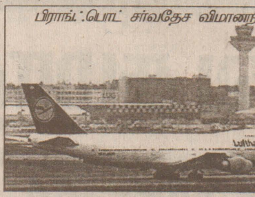
பிராங்.டொட் சர்வதேச விமானநிலையம்

மேற்படி இரு சந்தேக நபர்களையும் கைது செய்யுமாறு அமெரிக்க அரசாங்கம் ஜெர்மனிய அரசை கேட்டுக் கொண்டது. 2001 ஆம் ஆண்டு செப்டம்பர் 11 ஆம் திகதி அமெரிக்கத் தாக்குதலின் பின்னர், ஜெர்மனிய புலனாய்வுத்துறையினர் விழிப்புடனேயே இருப்பதாக அந்நாட்டுப் புலனாய்வுத்துறைப் பேச்சாளர் தெரிவித்துள்ளார். குறிப்பாக, பிராங்.டொட் விமானநிலையம் - மத்திய கிழக்கு, அமெரிக்கா மற்றும் ஐரோப்பாவிற்கான பிரதான தரிப்பு நிலையமாகக் காணப்படுவதால் அங்கு பாதுகாப்பு பலப்படுத்தப்பட்டுள்ளது.