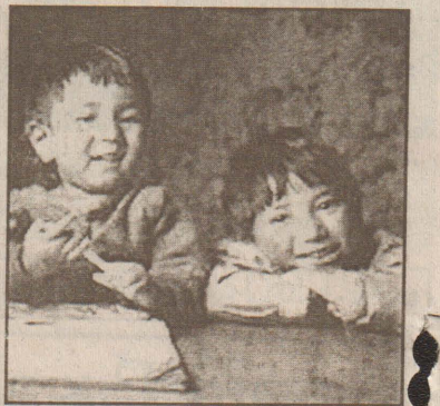
மாறுகின்றனர் எனத் தெரிவித்துள்ளார்.

நேபாளத் தலைநகர் காத்தமண்டுவில் நெசவுத் தொழிற்சாலையில் வேலை செய்த பதினான்கு சிறுவர்களை நேபாளியப் பொலீஸார் மீட்டுள்ளனர்.