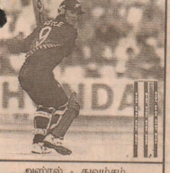
அஸ்ரல் - துவம்சம்.

முடிவில் 6 விக்கெட் இழப்பிற்கு 306 ஓட்டங்கள் பெற்றது. அந்த அணியின் கிப்ஸ் பெற்ற அற்புதமான