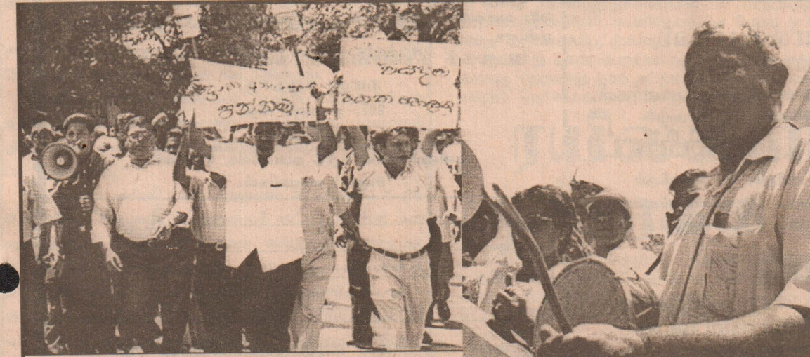
நேற்றுமுன்தினம் எதிர்க்கட்சிகள் நடத்திய அரசுக்கெதிரான சத்தமெழும்பும் போராட்டத்தின் மேலும் சில காட்சிகள்.

கப்பட்டு, ஓய்வூதியம் பெறபவர் குறிப்பிட்ட இடத்திற்குச் சென்று தங்களது அடையாளங்களை நிரூபித்து தமது ஓய்வூதியத் தொகையைப் பெற்று வந்தனர். ஓய்வூதியக் கொடுப்பனவுகளில் கடந்தகாலங்களில் இடம்பெற்ற மோசடிகள் காரணமாகவே இந்தப் புதிய நடைமுறை உடனடியாக அமுலுக்குக் கொண்டுவரப்படுவதாகத் தெரிவிக்கப்படுகிறது.