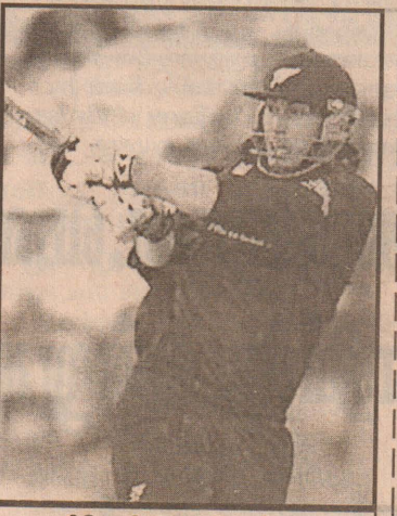
பிளேமிங் - திருவிழா.

ஆனாலும், சொந்த மண்ணிலே தென்னாபிரிக்கா தோற்பதைத் தாங்க முடியாத இயற்கை, மழை மூலம்