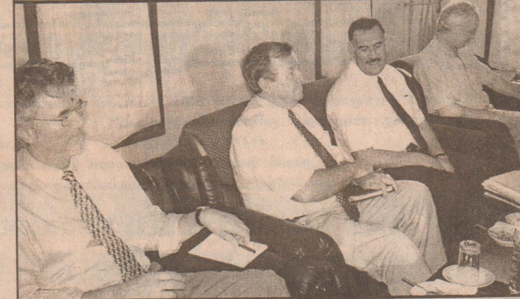
நேற்றைய சந்திப்பில் கலந்துகொண்ட புலிகள் தரப்பினரையும் சிறான் பணிப்பாளரையும் முதற்படத்திலும், வருகை தந்த குழுவினரை இரண்டாவது படத்திலும் காணலாம்.