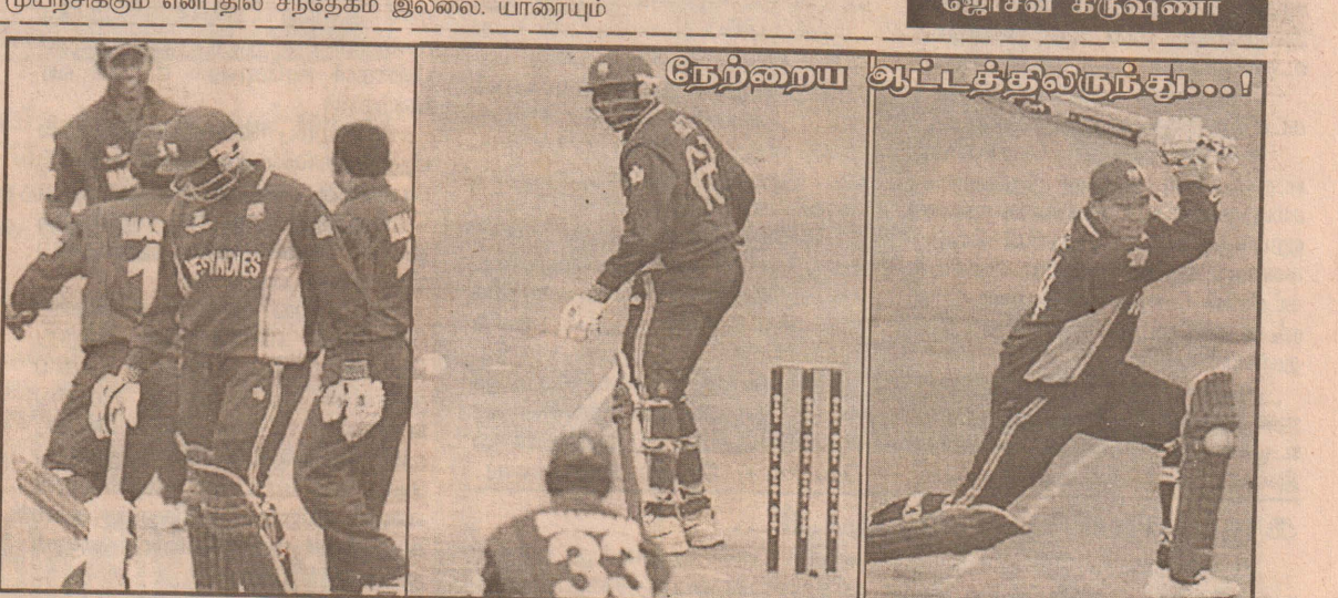
பவலின் அரைச் சதத்தை நோக்கிய அதிரடித் துடுப்பாட்டம்.

கைலை ஓட்டமெதுவும் பெறாமலேயே வித்திய மகிழ்ச்சியில் பங்களாதேஷ் வீரர்கள். வைரண்ட்ஸ் - பெரிதாகச் சோபிக்காத ஆரம்பத் துடுப்பாட்டம்.