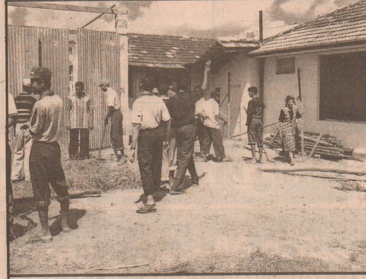
யாழ்ப்பாணம் போதனா வைத்தியசாலையில் மருத்துவப் பிடிமாணவர்கள் கடந்த ஞாயிற்றுக்கிழமை சிரமதானப் பணிகளில் ஈடுபட்டிருந்ததைக் காண்கிறீர்கள்.

எடுத்துக்கூறினார். இவ்விகாரத்தை கடற்படையினரே பெரிதுபடுத்தியதாகவும் அவர் குறிப்பிட்டார். அவசர கலந்துரையாடல் யாழ்ப்பாணம் கல்வித்துறை 1 ஆம், 2 ஆம், 3 ஆம் அணி மாணவர்களுக்கான அவசர கலந்துரையாடல் இன்று காலை 9 மணிக்கு உடற்கல்வித்துறை விரிவுரை மண்டபத்தில் நடைபெறவுள்ளது. இக்கூட்டத்தில் சகல மாணவர்களையும் கலந்துகொள்ளும்படி உடற்கல்வித்துறைத் தலைவர் அறிவித்துள்ளார்.