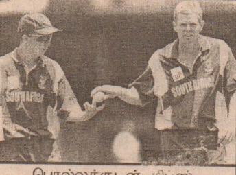
பொல்லக்குடன் கிப்ஸ். தலைமை சரியில்லை.

கடந்த 16.02.2003 அன்று Johannesburg மைதானத்தில் மிகவும் பரபரப்பாக நடைபெற்று முடிந்திருக்கின்றது நியூசிலாந்து எதிர்