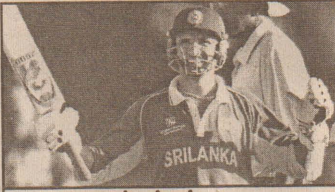
அத்தப்பத்து - கைகொடுக்கும் நாயகன்

பிழையாகக் கணித்திருக்கிறார். (இது தான் விதியா?) நிச்சயமாக போட்டியில் கொடுத்த ஓட்டங்கள் கட்டாதித்தான் மைதானத்தின் மத்திக்குச் செல்லவில்லை என்பது உண்மைதான். ஆனால், 229 என்ற செய்தி பவுச்சருக்குச் சென்றது நிச்சயமானது என்கிறார் பொல்லொக். பவுச்சர் என்ன செய்தார் பாவம். தனக்கு வழங்கப்பட்ட கட்டளைபைச் சரியாகவே நிறைவேற்றினார் அவர். இறுதியானதாக இருந்திருக்கும் என்ற அந்த ஓவரில் முரளியின் ஐந்தாவது பந்தை ஒரு SIX ஆக்கி 229 என்ற எண்ணிக்கையாக்கிய பவுச்சர், இறுதிப் பந்தை MID WICKET ஸ்டிரைக்கில் தள்ளிவிட்டார். இந்த நிலையில், இலங்கை முகாம், தென்னாபிரிக்க முகாம், 22 ஆயிரம் ரசிகர் கொண்ட மைதானம் எல்லாப்பக்கமும் பல்வேறு ஊக்கங்கள். அதன் தொடர்பில் மகிழ்ச்சியான வெளிப்பாடுகள். ஆனால், அந்த ஆட்டம் அற்புதமானதொரு அணியின் கையில் இருந்து நழுவிப் போய்விட்டிருந்ததும் - அணியே இந்த