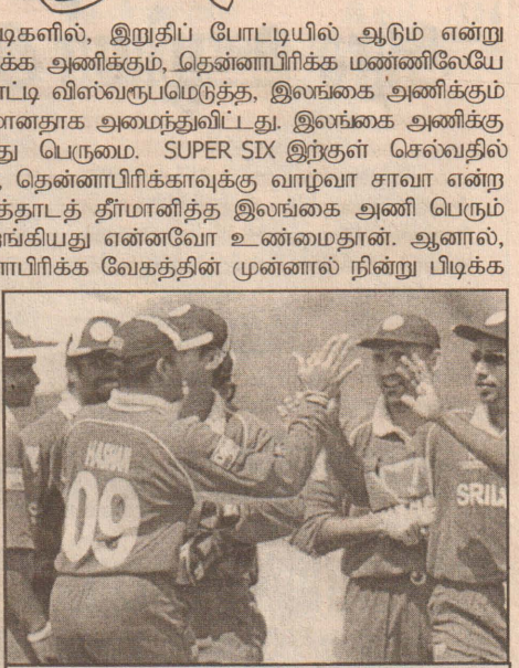
இலங்கை அணி - மீண்டும் 96 வருமா?

தென்னாபிரிக்கா ஆட்ட தொடங்கிய போது, இரண்டு அணிகளுமே என்ன செய்யும் என்று ஊக்கிக் முடியாததொரு நிலையே காணப்பட்டது. ஆரம்பத் துடுப்பாட்டவீரர்கள் இலங்கை அணியின் வேகப்பந்து வீச்சாளர்களை, இலாவகமாகச் சமாளிக்க ஓட்டங்கள் வேகமாக ஏறத் தொடங்கின. ஏற்ற இறக்கங்கள் இருந்தாலும் மார்க் பவுச்சரும், குளுஸ்னரும் ஒன்று சேர்ந்தபோது இலங்கைக்கு ஒரு முழுசாட்டம் ஏற்பட்டது. ஆனால், ஏற்பட்ட மழையில் 229/6 என்ற நிலையில் ஆட்டம் தடைப்பட்டது. இறுதியில் ஆட்டம் கைவிடப்பட்டு, இரண்டு அணிகளும் சமம் என்றவாறு தீர்ப்பளிக்கப்பட்டது.