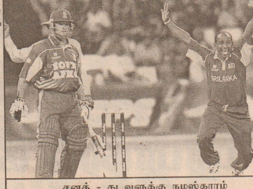
சனத் - கடவுளுக்கு நமஸ்காரம்

தத் திருவிழாவில் இனி இல்லையென்றாகிவிட்டதும், நிச்சயமாக இருந்ததை ரசிகர்கள் எவருமே சரியாகப் புரிந்துகொள்ளக் கூடியதாக இருக்கவில்லைதான். ஆனால், இறுதியில் எல்லோருக்கும் எல்லாமே தெளிவுக்கு வந்தபோது மைதானம் மட்டும் மங்கலாகவே புகார்படிந்தே இருந்தது. அதற்குக் காரணம் வருண பகவான்விட்ட கண்ணீரா? அல்லது இருபத்திரண்டாயிரம் தென்னாபிரிக்க ரசிகர்கள் (அந்த நிலையில் மைதானத்தில் இருந்த அனைவருமே) சொரிந்த கண்ணீரா? புரியவேயில்லை.