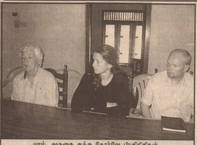
யாழ்ப்பெண்கள் தந்த நோர்வே பிரதிநிதிகள்

(யாழ்ப்பாணம்) யாழ்ப்பெண்கள் தந்த நோர்வே பிரதிநிதிகள் நேரில் ஆராய்வு செய்துள்ளனர்.