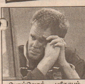
பொல்லொக் - பரிதாபம்

சர்வதேசக் கிரிக்கெட் ஆட்டங்கள் அதுவும் உலகக் கிண்ணக் கிரிக்கெட் போட்டிகள் மகிழ்ச்சிகரமானவையா? இல்லை. சில வேளைகளில், மிகத் துயரமானவை. துயரம் சில சில பகுதி ரசிகர்களை மட்டும் பாதிக்கும். சில துயரங்கள் கிரிக்கெட் உலகையே தாக்கும். அதுவே, திங்கட்கிழமை நடைபெற்றது. தென்னாபிரிக்கா இறுதிப்போட்டியில் - அவுஸ்திரேலியாவுடன் போட்டியிடும் என்று நிச்சயமாக எதிர்பார்க்கப்பட்ட அணி. ஆனால், நடந்ததை கிரிக்கெட் ரசிகர்கள் நன்கு அறிந்திருப்பார்கள். திறமைவாய்ந்த தென்னாபிரிக்க அணியை அதிர்ஷ்ட தேவதை ஏன் அணைக்க மறுக்கிறாள்? புரியாத புதிராகவே இருக்கிறது. ஒரு முறையா? இரண்டு முறையா? இது முன்றாவது முறை. தென்னாபிரிக்கா, உயர் கிண்ணம் ஒன்றைப் பெறுவதில் திறமை இருந்தும் தடுக்கி விழுந்தமை. ஷோன் பொல்லொக் ஒரு விடயத்தை மிக மனவருத்தத்துடன் ஒப்புக் கொள்கிறார். DRESSING ROOM இல் தான் போட்டி கணக்கு - தப்பிதமானது என்பதும், அதுவே தங்களை அடுத்த கட்டத்திற்கு நகர்வதைத் தடை செய்து விட்டது என்றும் கூறுகின்றார். மழை பொழிய ஆரம்பித்ததும், மழையால் ஆட்டம் தடைப்பட்டால் என்ற ஊகிப்பில், இரு அணி முகாம்களிலும் சில கணிப்பீடுகள் நடைபெற்றுள்ளன. அந்த வகையில், சனத் சரியான கணிப்பீடு செய்து, ஷோன் பொல்லொக் தவறான கணிப்பீடு செய்து திருக்கிறார். ஒரு TIE நிலையை உருவாக்க, 229 போதும் என்பதை சனத் சரியாகவே கணக்கிட்டிருக்கிறார். ஆனால், வெற்றிக்கு 230 தேவையென்பதை சரியாகக் கணிக்காத பொல்லொக் 229 காணும் என்று