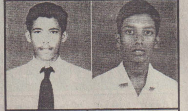
கு. அபிமாறன் பி.பியோமதுகுதனன்

மகிழினி கையலங்கிச்செல்வம் 9A B, ரத்தினாதேவி ரங்கநாதன் 9A