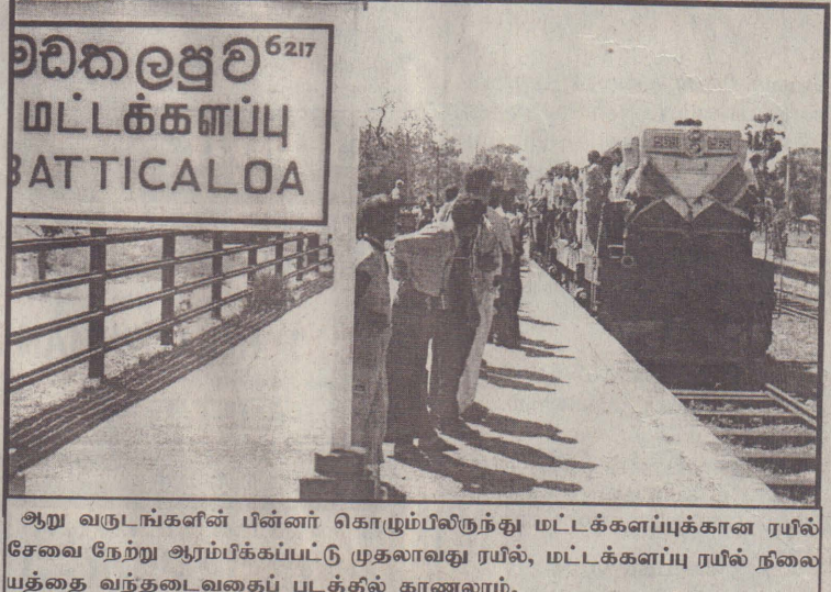
ஆறு வருடங்களின் பின்னர் கொழும்பிலிருந்து மட்டக்களப்புக்கான ரயில் சேவை நேற்று ஆரம்பிக்கப்பட்டு முதலாவது ரயில், மட்டக்களப்பு ரயில் நிலையத்தை வந்தடைவதைப் படத்தில் காணலாம்.

இந்திய மீனவர்களை விரட்டச் சென்ற வடமராட்சி மீனவர்களை கடற்படை விரட்டியடித்தது (வடமராட்சி) எல்லைமீறி வந்து வடமராட்சிக் கடற்பரப்பில் மீன்பிடித்தும், உள்ளூர் மீனவர்களின் உடைமைகளைச் சேதப்படுத்தியும் வந்த இந்திய மீனவர்களைத் திருப்பி அனுப்பச் சென்ற வடமராட்சி மீனவர்களைக் கடற்படையினர் விரட்டியடித்தனர். நேற்று 3 மணியளவில் - நூற்றுக்கும் மேற்பட்ட டீரோலர்களில் வடமராட்சிக் கடற்பரப்பில் மீன்பிடித்துக் கொண்டிருந்த இந்திய மீனவர்களைக் கைது செய்யுமாறு கடற்படையினருக்கு அறிவித்தும், கடற்படையினர் அவர்களைக் கைதுசெய்யாதுவிட்டதன் காரணமாக - வடமராட்சிப் பிரதேசத்திலிருந்து மயிலிட்டி, காங்கேசன்துறை, சுப்பர்மடம், முனைப் பிரதேசங்களைச் சேர்ந்த மீனவர்கள் இந்திய மீனவர்களைத் தடுப்பதற்காகச் சென்றவேளை, அவர்களைக் (10 ஆம் பக்கம் பார்க்க)