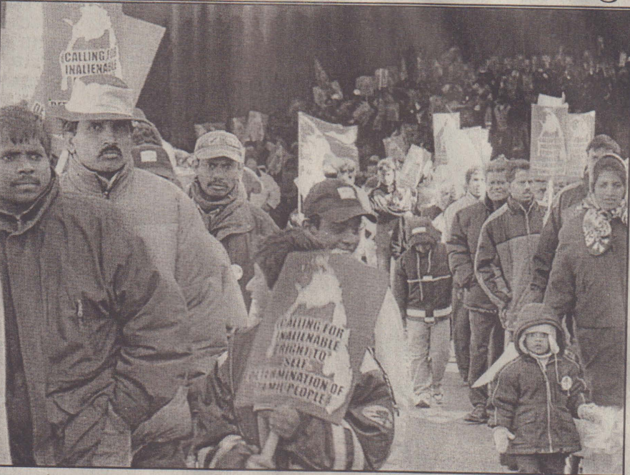
கடந்த திங்களன்று ஜெனீவாவில் ஈழத்தமிழர்கள் நடத்திய பேரணியில், தலைவர் பிரபாகரனின் முழு உருவப்படம் தாங்கிவரப்படுவதையும், அதில் கலந்துகொண்டோரில் ஒரு பகுதியினரையும் படங்களில் காணலாம். (மேலும் படங்கள் 9 ஆம் பக்கத்தில்)