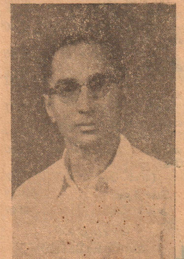
ஜனப் முகம்மது அலி