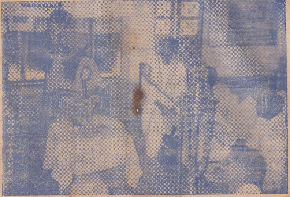
வாராசி என்னும் காசியில் குமரகுருபர சுவாமிகள் மடத்தில் திருப்பனந்தாள் மடாதிபதிகள் தலைமையில் தொழிலதிபர் பஞ்சபுராண வெளியீட்டில் பேசுகிறார்.

எண்பத்தேழு எம்மை ஓரளவுக்கு வருத்தி விட்டது என்று உலகம் முழுவதும் அறிந்துவிட்டது. வரலாற்றாசிரியர் உன்னை ஆழமாக வரைந்து எதிர்காலத்தவர் அறியும் வகை செய்வார்கள். அவுணர், அசுரர் காலத்தோடு உன்னையும் சேர்த்து விடுவார்கள். இதனால் 2087 ஆம் ஆண்டுக்கும் வசையுண்டாகுமோ என நினைக்கவேண்டியுள்ளது. பேயோடு கூடிப்பிரிவதும் மன வருத்தம் என்பர். வருத்தம் என்னவாயினும் நீ போய் வா.