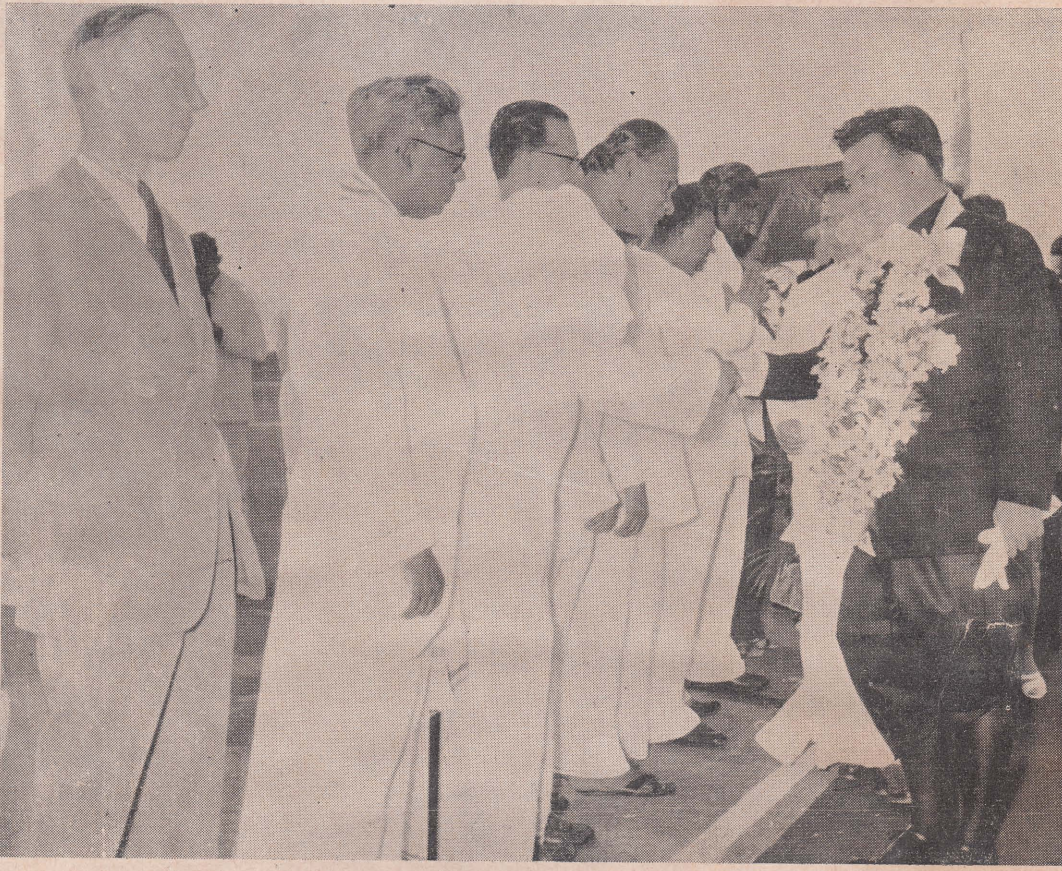
கம்போடிய இளவரசர் (நொரோடம்) சிகனாக் அவர்கள் இலங்கை வந்தபொழுது இரதமலானையில் மந்திரிகளால் வரவேற்கப்படுகிறார்.