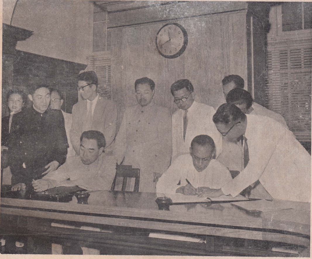
இலங்கைப் பிரதமர் திரு. எஸ். ப்ளியூ. ஆர். டி. பண்டாரநாயக்கா அவர்களும் சீன மக்கள் குடியரசின் பிரதமர் திரு. சௌ என் லாயும் பஞ்சசீலக் கூட்டுறிக்கையில் கையெழுத்திடுகின்றனர்.

நாடுகளுக்கும் இருப்பதால், நாங்கள் ஒன்று சேரவும் ஒருவரை ஒருவர் அறிந்துகொள்ளவும், ஒத்துழைக்கவும் சாத்தியமாகி யுள்ளது.