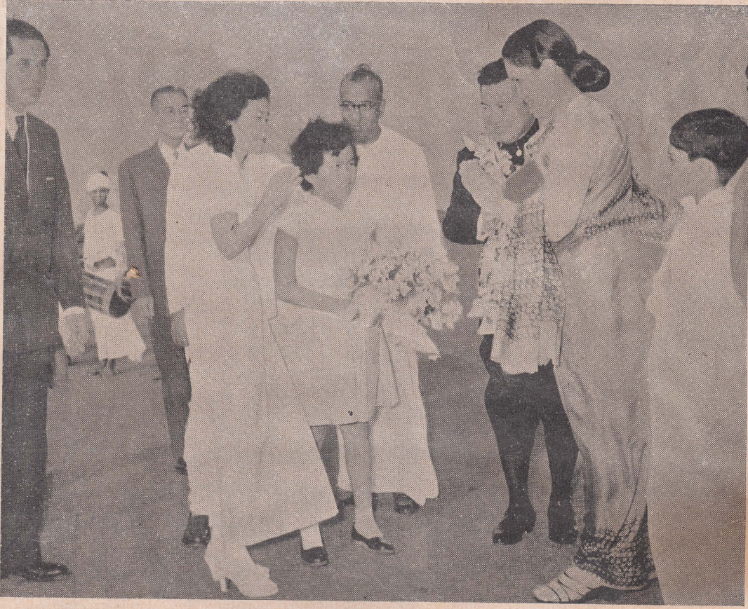
பெப்ரவரி மாதம் 13 ந் திகதி இலங்கைக்கு வருகை புரிந்த கம்போடிய இளவரசரான நொரோடம் சிகனுக் அவர்களையும், அவரது குமாரியையும் திருமதி பண்டாரநாயக்கா இரத்மலானை விமான நிலையத்தில் வரவேற்கும் காட்சி. பூச்செண்டைக் கையிலேந்தி இருப்பவர் இளவரசியாவார்.