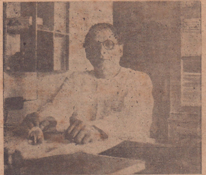
'ஈழகேசரி' பொன்னையா [4-ம் பக்கம்]