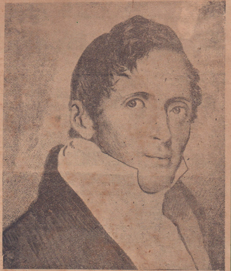
சிங்கப்பூரின் கதாநாயகன் [3-ம் பக்கம்]