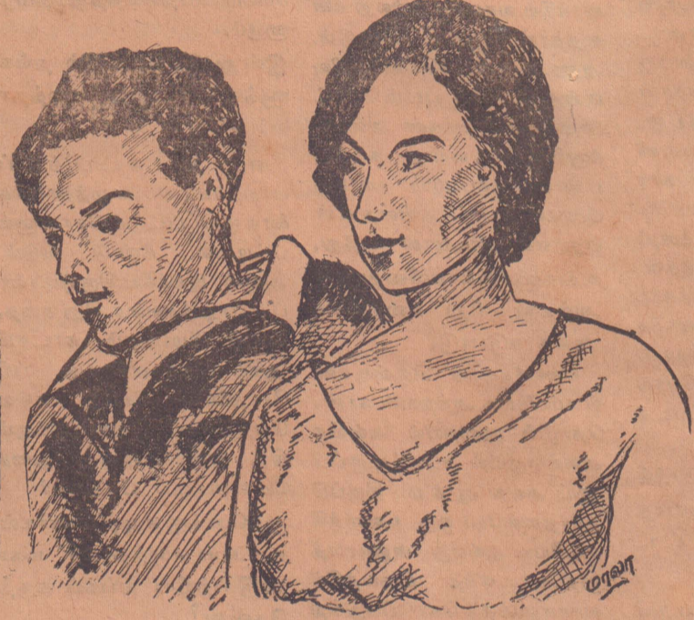
எடித்தும் அவளது இளங்காதலன் பைவாட்டேர்ஸும்

"ஈ சென்றபின் அன்றொரு நாள் என் கணவர் என்னை நெருங்கினார். அவர் என்னைத் தொடுவதையே நான் விரும்பவில்லை. 'என் மீது உனக்கு அன்பில்லை யா? என்று அவர்