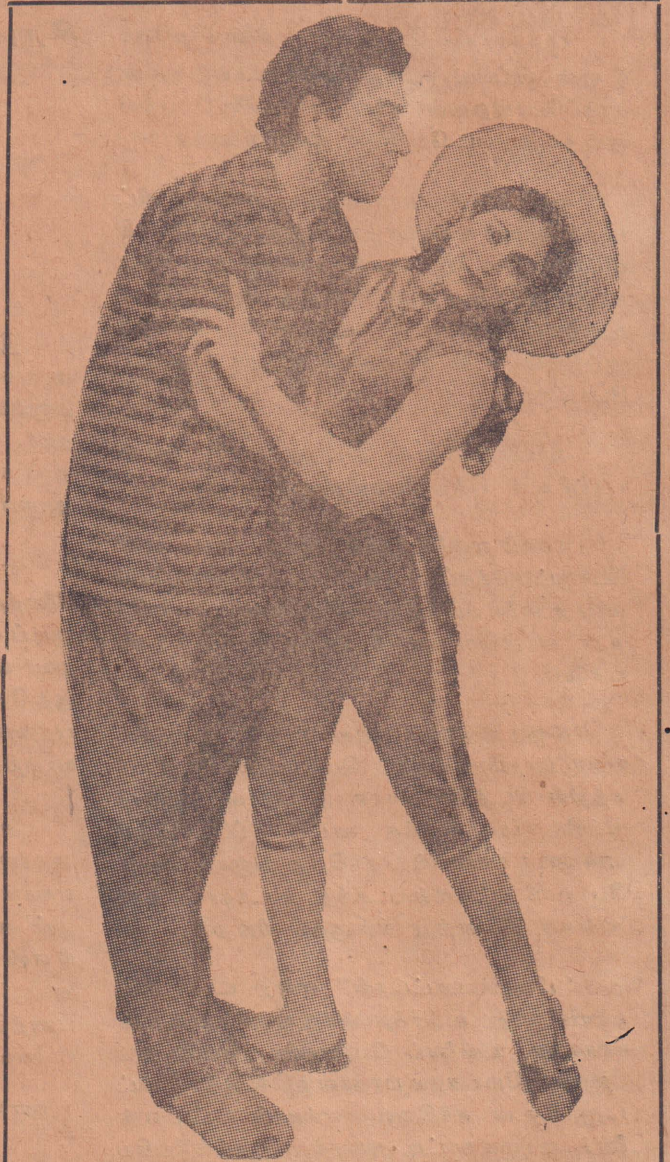
“ரெக் ரெக் ரெக்..... ரெக் அன் த ரேல்!”

இதில்இன்னொரு விசேஷம் என்னவென்றால், இப்படத்தின் திரைக்கதையை பாலச்சந்தரே எழுதுவதுடன், டைரக்ஷன், இசையமைப்பு ஆகியபொறுப்புகளையும் அவரே ஏற்றிருப்பதுதான்!