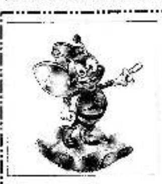
Supplied of Explosion தமுரைக்கிசுல துவகர்

அல் ஐவீறா ម៉ាល្លាលប៉ា ខេសប៉ា 21/1, Symond' S Road Colombo-10