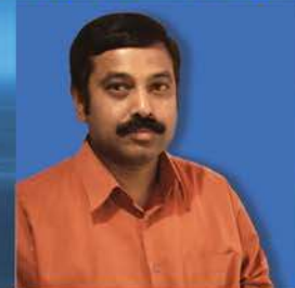
தமிழில் தொடர்பு கொள்ள கீ. அருள்தாஸ்

தமிழ் நாட்டை சுற்றி பார்க்கும் வசதி நல்ல முறையில் ஏற்பாடு செய்ய தொடர்பு கொள்ளவும்