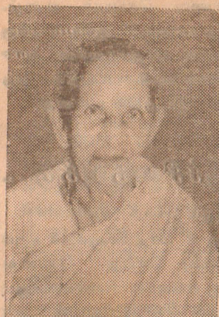
இன்னாகிமுத்து ரோசமுத்து மண்ணில்: விண்ணில்: