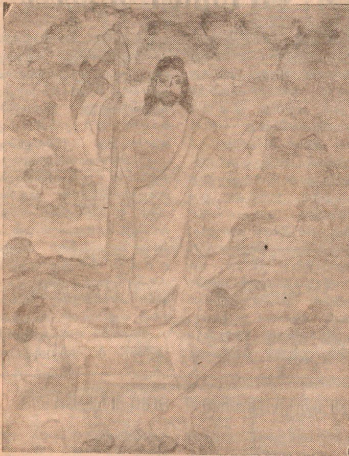
செல்வி. அருளானந்தம் ரோசாலினி

ஓவியப் போட்டி 14 இல் பரிசு பெறும் ஓவியம் உயிர்ப்பின் மகிமையில் யேசு