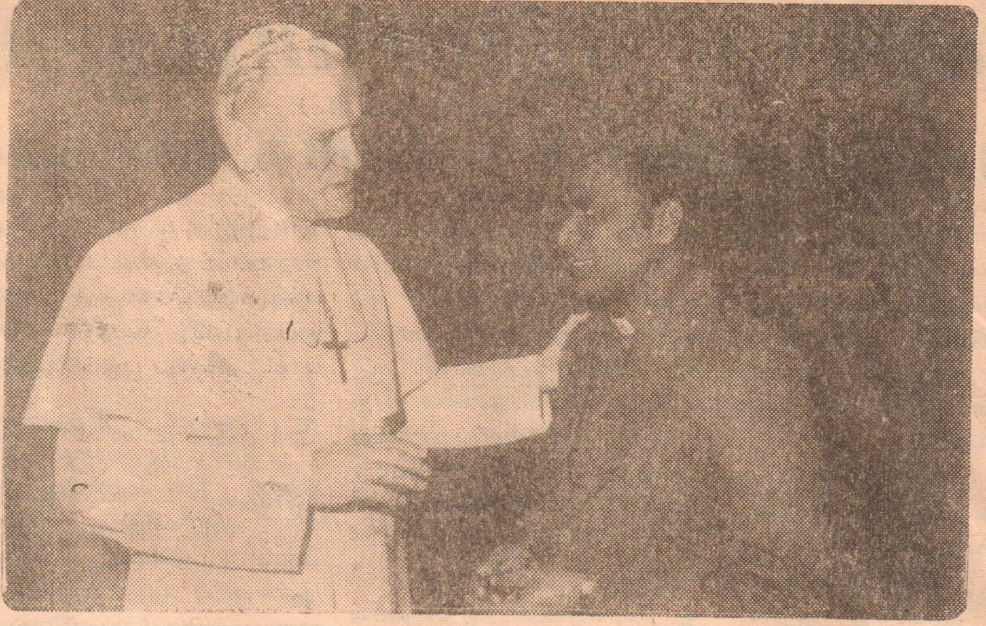
பரிசுத்த தந்தை 2ஆம் அருள் சின்னப்பரின் நல்வாழ்த்துக்களும் ஆசீரும்