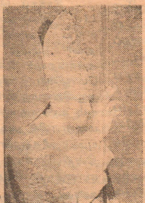
26ஆவது உலக கத்தோலிக்க அமைதித்தினம் 1993

ஐனவரி முதல் நாளன்று அனுசரிக்கப்படுகின்றது. இவ் அமைதித்தினத்திற்கென திருத்தந்தை வெளியிட்டுள்ள செய்தியில் உலக அமைதிக்குப் பெரும் அச்சுறுத்தலாய் இருக்கும் ஏழ்மை குறித்து மானுடத்தின் மனச்சான்று மறக்கக் கூடாது என்பதை வலியுறுத்தியுள்ளார். ஆசியா, ஆபிரிக்கா, லத்தீன் அமெரிக்கா ஆகிய கண்டங்களின் சில நாடுகளின் வறுமையைப் பற்றிக் கோடிட்டுக் காட்டிய பாப்பிறை மிக