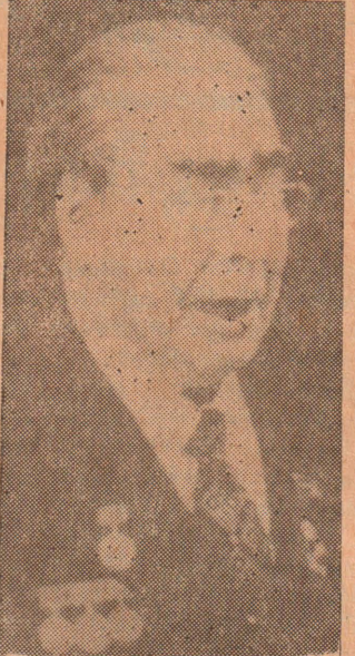
தெஷ்னேவ் நாரி உதவி மெய் ராணர் 1939ம் ஆண்டு அப்பிராந்திய கம்யூனிஸ்ட் கட்சியின் பிரசார செயலாளராகவும் இருந்தார். 1940 ஐ.ஓ.ஊ. மாதத்தில் அப்பிராந்தியக் கைத்தொழிலு யுத்த நிகைகு ஏற்றவாறு மாற்ற அவருக்குப் பின் மாநாட்டில் மத்திய

உலக சமாதானத்தைப் பேணவும் அணு ஆயுதப் போரைத் தவிர்த்தவும் உலக அழிவை கொண்டுவரக்கூடிய நியூகிளியர்(நியூட்ரன் குண்டு) போரைத் தவிர்த்தவும் தமது வாழ் நாளை அர்ப்பணித்த மறைந்த தோழர் லியோனித் இலிச் பிரெஷ்னேவ், இவர் 1906-ம் ஆண்டு டிசம்பர் மாதம் 19ம் திகதி தொழிலாளர் குடும்பத்தின் பிறந்த தவர். தனது 9-வது உயதில் தான் வாழ்ந்த நகரப் பாடசாலையில் சேர்ந்து எல்வி கற்றார். 15-வது வயதில் தகப்பன் வேலைசெய்த எங்கு ஆலையில் வேலைக்கு அமர்ந்தார். அங்கு சிறந்த தொழிலாளியாக மாத்திரம் அல்ல ஒரு தொழிற்சங்க ஊழியராகவும் கடமையாற்றினார். அக்டோபர் மாபெரும் புரட்சியைத் தொடர்ந்து ரஷ்யாவில் ஏற்பட்ட உள்நாட்டு யுத்த சாலத்தில் தாம் வசித்த ஊரைவிட்டு அவரது குடும்பம் குருஸ் மாகாணத்திற்கு இடம் பெயர்ந்திருந்தது. அங்கு நில அளவையாளர் கல்லூரியில்