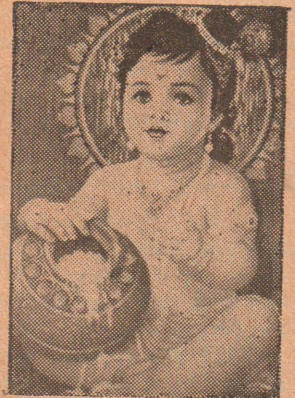
அனைவருக்கும் தந்தீக்கும் தீபாவளி வாழ்த்துகள் - ஈழநாடு

அச்செய்தியினை மேலூர்கூறப்பட்டிருப்பதாவது: "தமிழினத்தின் இலட்சிய தற்கால தம்மை ஆர்ப்பணித்து சிறையிலிருக்கும் தமிழ் இளைஞர்கள் பற்றி சிந்தித்துக் கொண்டிருக்கும் சூழ்நிலையில் நாம் தீபாவளி தினத்தை கொண்டாட 12-ம் பக்கம் பார்க்க)