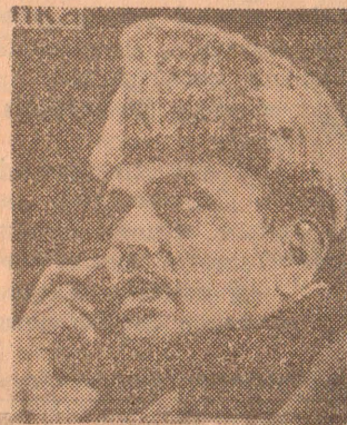
வி. பி. சிங்

புதன் மே 30 யோபர்ஸ் ஆயுத ஊழல் சம்பந்தப்பட்ட ஆவணங்களில் உள்ள விவரங்கள் எதுவும் எந்த ஒரு காரணத்தையும் தொண்டு வெளியிடப்பட மாட்டாதவை இரகசியமாக வைக்கப்படும்.