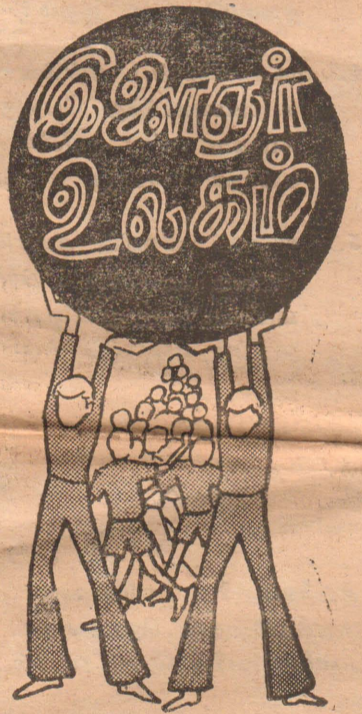
உயிர் உள்ளவரை உன்னை வெறுக்காதே அன்பு நெஞ்சன் வி. பி.

நல்ல நட்பு அன்பு இளம் உள்ளங்களுக்கு அன்பு செய்யும் ஆளை மறவாதே அறன் வளர்க்கும் நட்பைத் துறவாதே நன்மை செய்யும் நண்பனைப் பிரியாதே நாயகம் தவறும் நண்பனை நம்பாதே நல்லதொரு நண்பனை தவிதாக்க முயலாதே சந்தேகக் கண்கொண்டு சஞ்சலத்தை வளர்க்காதே, சந்தி சிரித்திடவே சிந்தியாமல் பழகாதே. உயிரினைக் கொடுக்கும் உறவினைக் கொடுக்காதே. உண்மை பேசும் உயிர்தனை உதருதே