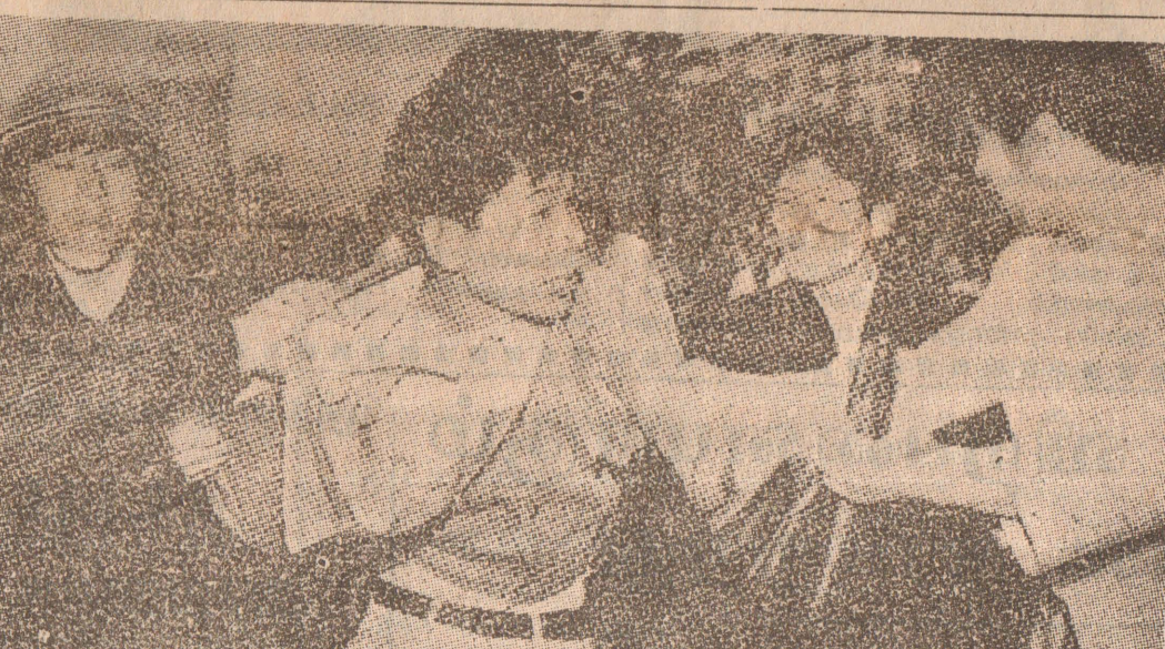
பாகிஸ்தானுக்கு கடத்தப்படவிருந்த 40 சிறுவர்கள் மீட்பு