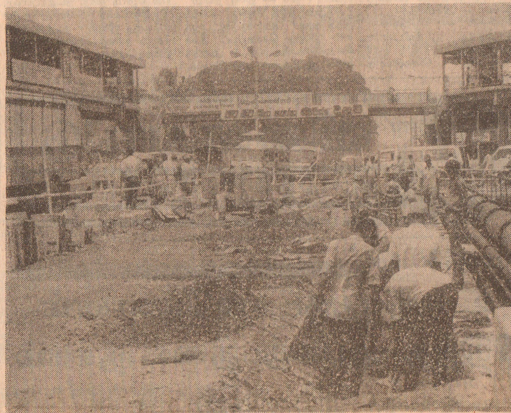
மருதானை சந்தியில் அமைந்தள்ள பாலத்தின் புனரமைப்பு வேலைகள் இப்போது தரிசு யில் நடைபெறுகின்றன. சுமார் நூறு ஆண்டுகள் பழைமை மிக்க இப் பாலத்தினை நவீனமயப்படுத்தி பணிகள் நடைபெற்றுக் கொண்டிருப்பதையே படத்தில் காண்கிறீர்கள். வாகனப் போக்குவரத்து நெருக்கடியைத் தவிர்ப்பதற்காக மேற்படி பாலம் விரிவுபடுத்தப் படவிருப்பது குறிப்பிடத்தக்கது [எ*த]

துக்கும் மேற்பட்ட பாவனையா ளர்கள் இதவரை குமது தொலை பேசி நிலுவைக் கட்டணங்களை செலுத்தவில்லை. [ந-வ]