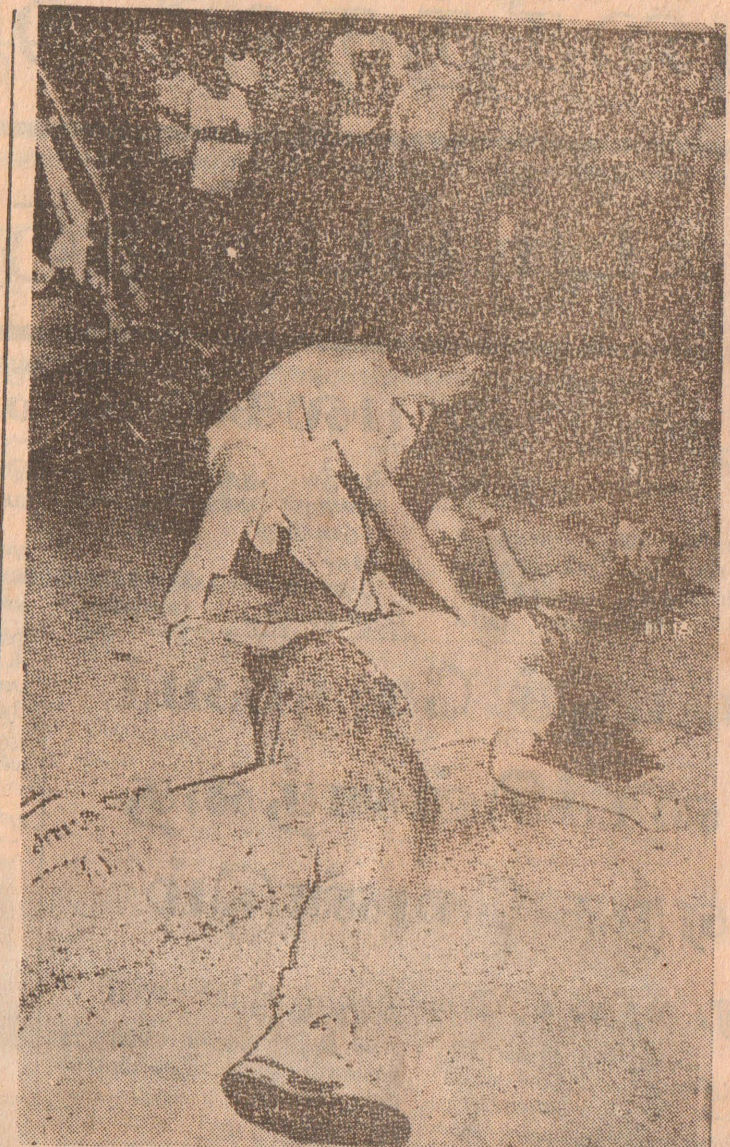
உயிரிழந்த அமெ. வீரர் பரிசோதனை

மனிதவிலைக்கு சமர் 80 கிலோ மீட்டர் தொலைவில் வடக்கில் உள்ள ஏன்ஜலில் நகரில் அமெரிக்கர்கள் இருவர் அண்டையில் படுகொலை செய்யப்பட்டனர். அமெரிக்க விமானப் படையைச் சேர்ந்த இந்த வீரர்கள் இருவரையும் டாக்டர் ஒருவர் பரிசோதிப்பதை படத்தில் காண்க. (எ* த)