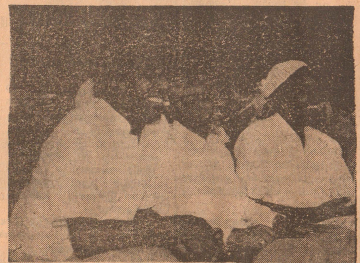
நொன்பு பெருநாள் விழா

பெற முடியும் என்பது இத்தறை யின் மற்றொரு விசேஷத் தன்மையாகும்- இவ்வாறாக நாட்டுக்கு பல் வகையில் உதவக் கூடிய இத் தறையை பழைய நிலைக்குக் கொண்டுவர இப்போது போது மற்றும் பலர் வேறுதொழில்