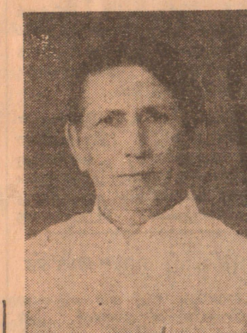
மஹ்ரூப் றுமைகளைப் போக்கி சாந்தியை யும் சமாதானத்தையும் ஏற் படுத்தட்டும்—

நோய் நிவாரணியான இந் நோன்பு வருடம் பூராவும் உண்டு கழிக்கும் நமது உடல் உறுப்புக ளுக்கு ஓய்வைக் கொடுக்கிறது— உணவு, உறக்கம் அருந்ததல் ஆகியவற்றை ஒரு மாதம் குறை த்த தெம்பையும் புதுப்பொலி வையம் ஏற்படுத்துகிறது— எனவே மனித இனம் முழுவ தும் நன்மைகளைப் பெற்று இரு உலகிற்கும் வழிகாட்டும் இந் நோன்புப் பெருநாள் நமது வாழ்விலும் நல்வழி காட்ட வேண்டும்— இந் நோன்புப் பெரு நாள் நமமிடையே நிலவுபு பல விதமான பிரச்சினைகள் வேற்