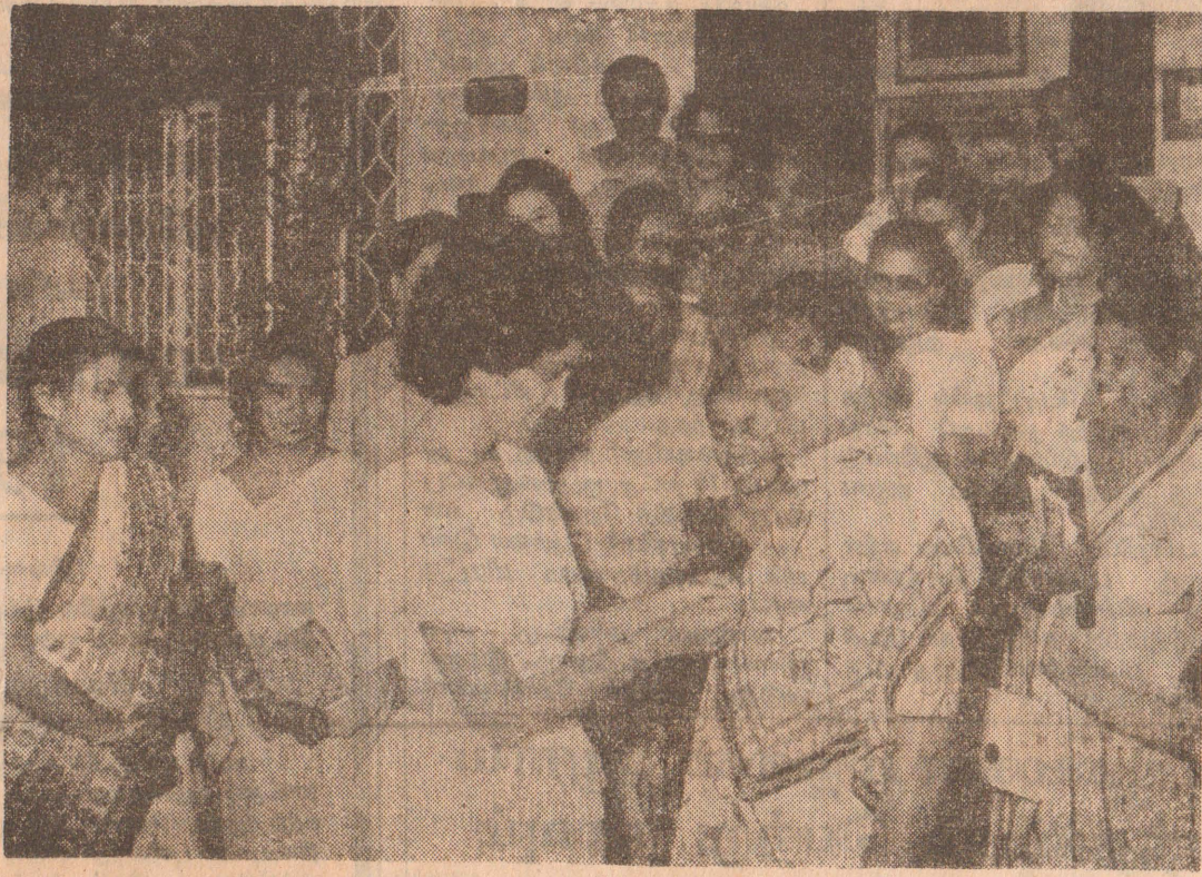
சர்வதேச மகளிர் தினம் - கொடி ஜனாதிபதிக்கு அணிவிப்பு

சர்வதேச மகளிர் தினம் எதிர்வரும் 8 ஆம் திகதி கொண்டாடப்படவிருக்கிறது— இதனையொட்டிய கொடி விற்பனை சேவா வலிதா இயக்கத்தினரால் நேற்று முன்தினம் ஆரம்பித்த வைக்கப்பட்டத— கச்சரித்த மண்டபத்தில் நடந்த முதலா