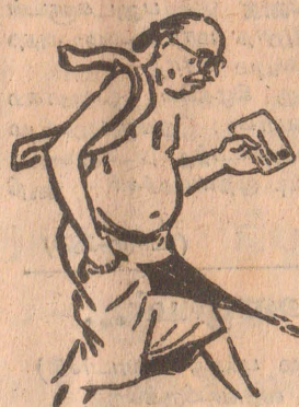
திறைமுகம் பெரிய களஞ்சிய மார்ச்சே! எலிகளுக்கா குறைச்சல் இருக்கும் பாருங்கோ.