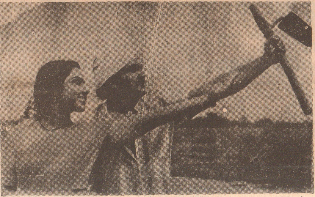
வரப்பு வெட்டி - வயல் திருத்தி - டீர் பாய்ச்சி - நெல் குவிக்க இளைசிகள் இரண்டு இணைந்த