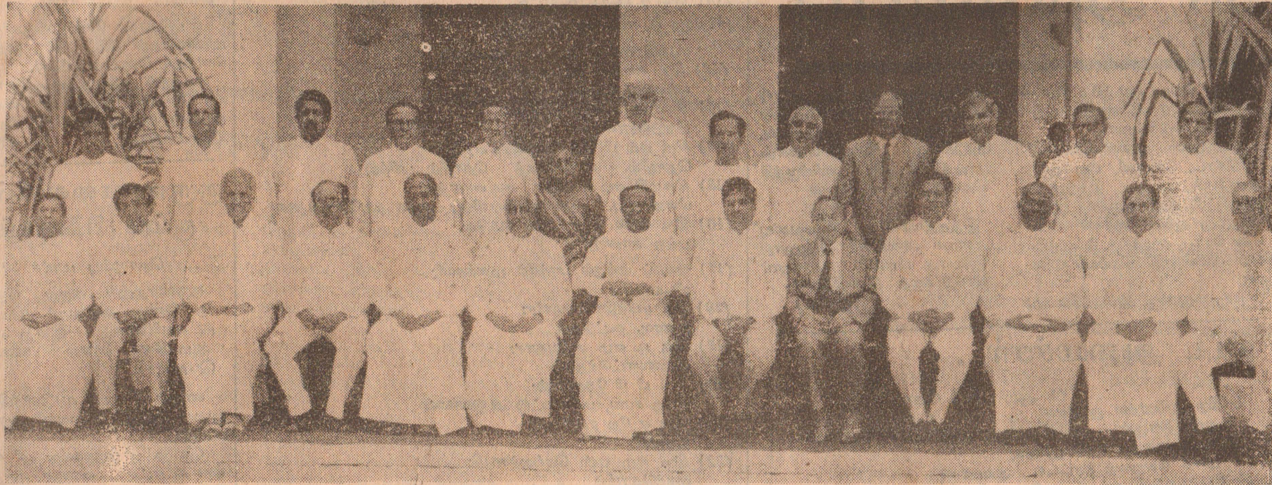
புதிய பிரதமரும் அமைச்சர்களும் பதவி ஏற்றதும் ஜனாதிபதியுடன் (மத்தியில்) எடுத்தக் கொண்ட படம்.

★ 6 புதிய அமைச்சர்கள் ★ காமினி விடுபட்டார் ★ ஹெரோல்ட் ஹொத் வெளிநாட்டு அமைச்சர்