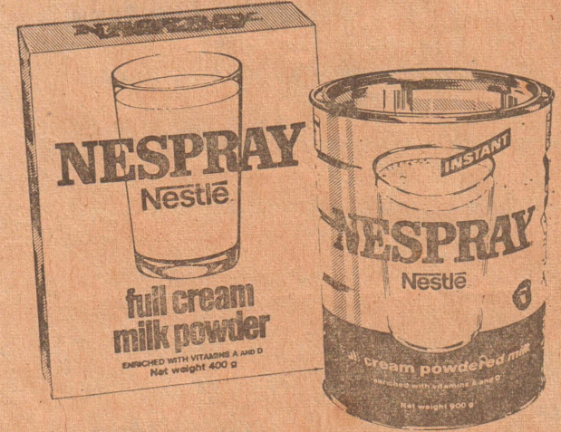
400 கிராம் ரூ. 26/90 900 கிராம் ரூ. 98/25

தினமும் ஓடியாடிச் சுறுசுறுப்பாக வளரும் பிள்ளைகளுக்கு நெஸ்பிரே சக்தியை வழங்குகிறது. உங்கள் பிள்ளைகள் ஆசையோடு பருகி, நாளொரு மேனியும் பொழுதொரு உண்ணமும் வளர்வதைக் கண்டு மகிழங்கள். இன்றே உங்கள் பிள்ளைக்கு நெஸ்பிரே கொடுங்கள்.