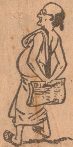
போலீஸை நல்ல மாற்றம் பாருங்கோ. இந்தக் கிராமத்தை மருந்ததான்

பாடசாலைகளில் கூட்டுறவுச் சங்கங்கள் அமைக்க லலித் நடவடிக்கை கொழும்பு, மே 6 ரங்கன் வழங்கப்படவிருக்கின்ற சகல பாடசாலைகளிலும் ரண.