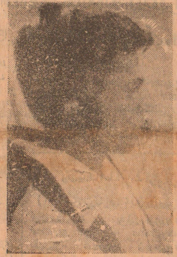
விமானி பிரிஸ் ஹெலிகொப்டருடன் அற்றுப் போனதன் பின்னர் அதனைத் தேடுவதற்கு முறைப்பாடு கிடைத்தது

இந்த விபத்த நேற்ற முன் தினம் மாலை ஹபரன் அருகே நிகழ்ந்தது. சிகிரியாவிலுள்ள ஹோட்டல் ஒன்றில் தங்கியிருந்த வெளி நாட்டு உல்லாசப் பிரயாணிகளிடம் இருந்த பணம் நகை ஆகியவற்றை கொள்ளை அடித்த விட்டு தப்பிச் சென்ற 17 பேரைத் தேடிச் சென்ற போதே இந்த விபத்த நடந்தது.