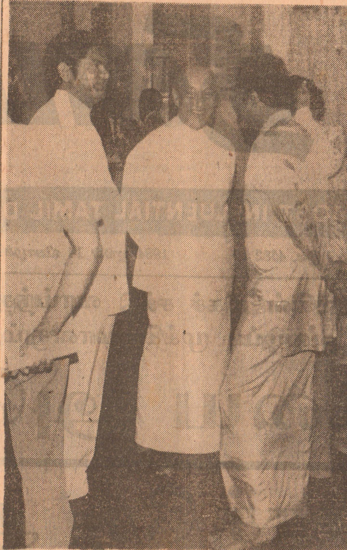
சுமித்ரயோ இயக்கத்தின் ஆதரவில் அமைக்கப்பட்ட "மெல்-மெதுர" - நிலைய திறப்பு விழாவுக்கு வருகை தந்த ஜனாதிபதி திரு. ஜே. ஆர். ஜெயவர்த்தன, இளம் அமைச்சர்களான லலித் அத்துலத் முதலி, காமிவி திலாநாயக்கா ஆகியோருடன் சுவாரஷ்யமாக உரையாடிக் கொண்டிருப்பதைப் படத்தில் காண்க.

வருகின்றது. அதனால் தான் கவலையீனமாக நடந்து கொள்ளும் வாகன ஓட்டிகளுக்கும் மரண தண்டனை வழங்க வேண்டுமென நான் கருதுகிறேன். இவ்வாறு ஜனாதிபதி கூறினார். மேற்படி "மெல் மெதுர" நிலையம் போதைப் பொருள் பிரச்சினைகள் சம்பந்தமான ஆராய்ச்சிகளையும் - போதைப் பொருள் பாண்ப்பவர்களைச் சீர்திருத்துவதற்கான நடவடிக்கைகளையும் மேற்கொள்ளும்.