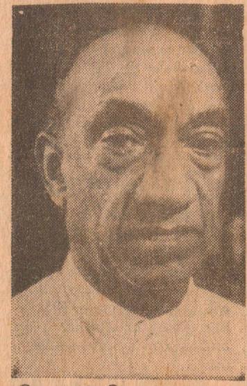
ஜே. ஆர். ஜெயவர்த்தன

இராணுவ ஒப்பந்தம் எதுவும் எந்தநாட்டுடனும் செய்யமாட்டேன் ஜனாதிபதி ஜெயவர்த்தன கூருத்து