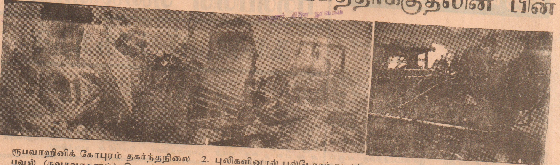
1. ரூபவாணிக் கோபுரம் தகர்ந்தநிலை பவல் (கவசவாகனம்) சிதைந்தபடி 2. புலிகளினால் புல்டோசர் மூலம் முகாம் நிர்மூலமாகிறது 3. ராணுவ (ஸ்தலத்திலிருந்து நமது நிருபர் கே. சந்திரசேகரம்)

● அல்லலுற்று ஆழி கடந்துவரும் தமிழ் உயிர் காக்க தமிழ் நாட்டில் இதய பூர்வ ஈடுபாடு