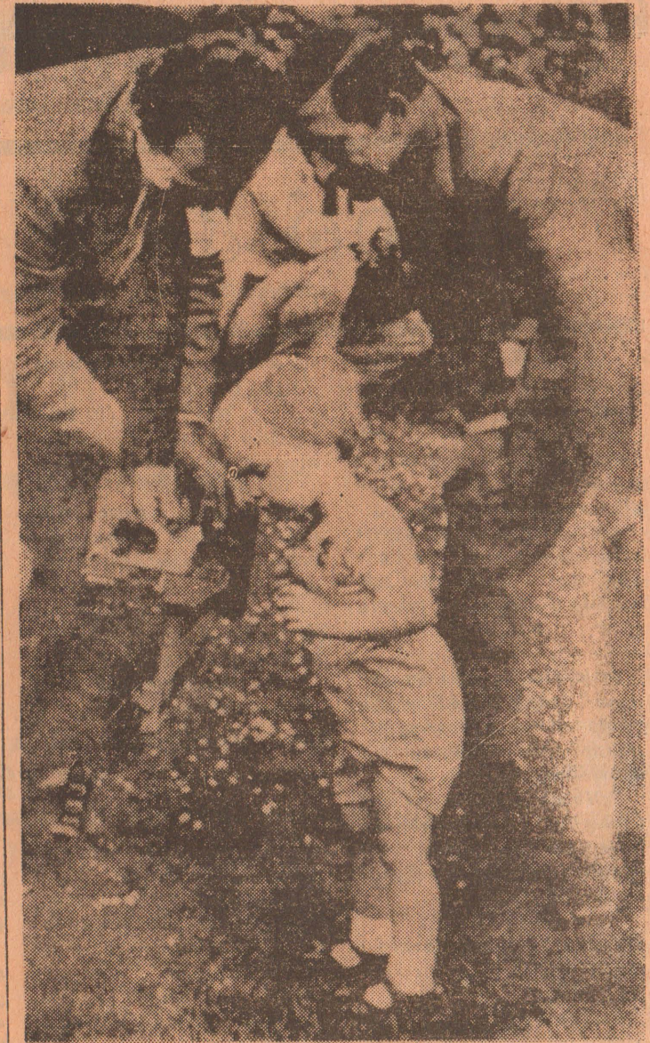
பிரிட்டனின் முடிக்குரிய இளவரசர் சார்ள்ஸின் மகனான இளவரசர் வில்லியம் டெலிவிஷன் காமிரா எப்படி இயங்குகிறது எனபதை அவதானத்துடன் நோக்குகிறார். அவரது தந்தை இளவரசர் சார்ள்ஸ் அருகில் நிற்கிறார். (ந)

கொல்லப்பட்டவர் தூதரக ஊழியர் எனக் கூறப்படுகிறது. இந்தக் குண்டுத் தாக்குதல் களை நடத்தியவர்கள் யார் என்பது இன்னும் கண்டுபிடிக்கப்படவில்லை. ஆனால் ஆர்மேனிய கொரில்லாக்கள் கைது வருகின்றனர். (ந)