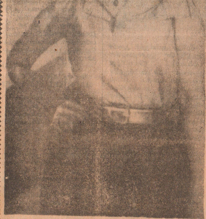
“நான் திரையுலகை ஆட்டிப் படைப்பதற்கு என் எடுப்பான தோற்றம் தான் காரணம்” என்று கூறுகிறார் சிலுக்கு. படம்: வாழ்க்கை- (ல-10)