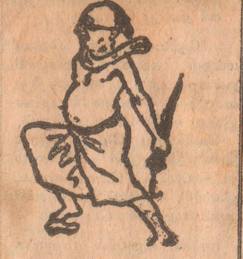
எண்ணெய் வள ஆராய்ச்சி என்பொழுதுமே வழ வழ சமாச்சாரம் பாருங்கோ!