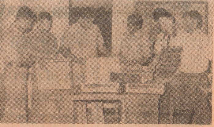
தலைமன்னர் கடற்கரைப் பகுதியில் கரை ஒதுங்கிய வீடியோ டெக்குகள் சிலவற்றை மீனவர்களிடமிருந்து, தலைமன்னர் பொலீஸார் கைப்பற்றினர்.