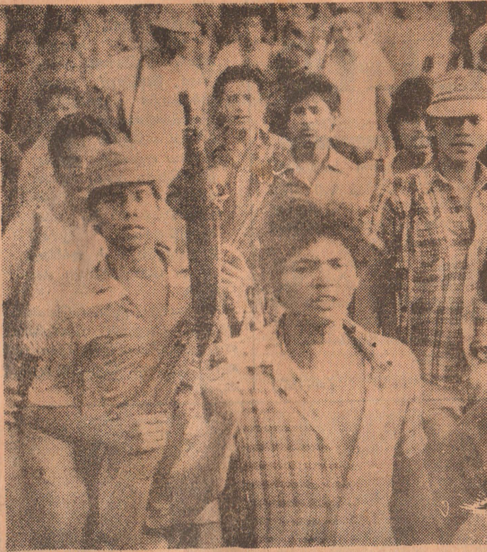
நீக்கராகுவா இடதுசாரி அரசாங்கத்தின் மக்கள் இராணுவம், அமெரிக்க ஆதரவைப்