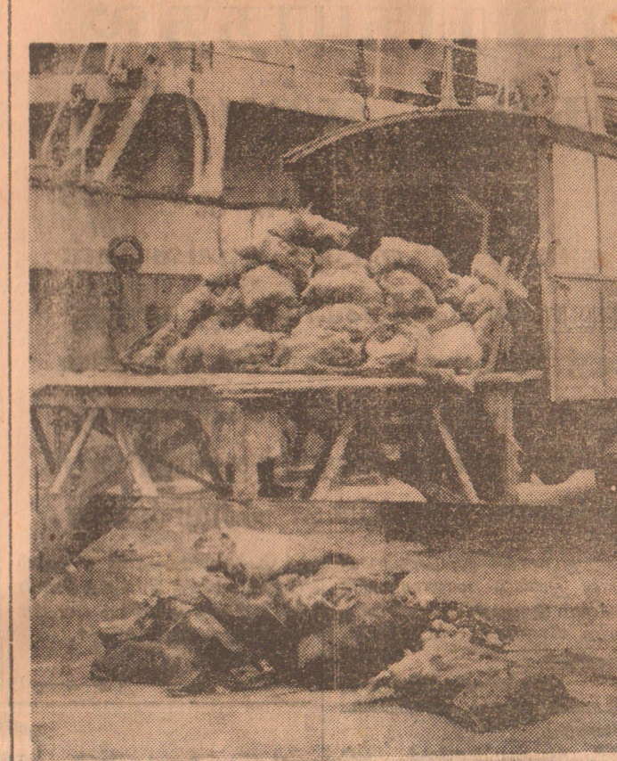
"நிக்நா" என்னும் சுப்பரில் வெள்களாயத் தட்டுப்பாட்டை நீக்கவந்ததால் வெளிமாடுகளி

கஸ்தெனிய, ஹல்பிட்டிய, ஆந்திரமட ஹிரிவாதுன்ன ஊடாக கரந்துபொன சந்தியை அடைந்து கொழும்பு - கண்டி வீதியில் செல்ல வேண்டும். ★ இதேபோன்று கண்டியிலிருந்து கொழும்பு வரும் சகல பஸ்களும், லொறிகளும் கரந்து பொன சந்தியில் திருப்பி விடப்படும். ரன்வலை சந்தியை அடைந்து கொழும்பு - கண்டி வீதி வழியை அடைந்து கொழும்பு - கண்டி வீதி வழியை அவை சென்றடைய வேண்டும். ★ மகாவலி அதிகார சபைக்குரிய சகல பாரிய வாகனங்களும் கொழும்பிலிருந்து கண்டி நோக்கிச் செல்லும் வழியில் அம்பேயுஸ்ல சந்தியில் குருநாகல் வழியாக திருப்பி விடப்படும். இதேபோன்று கொத்தலை, விக்டோரியா திட்டங்களிலிருந்து வரும் வாகனங்கள் பேராதனையிலும் கண்டியிலும் திருப்பி விடப்பட்டு குருநாகல் வழியாக கொழும்புக்குச் செல்ல அனுமதிக்கப்படும் (எ-ய)