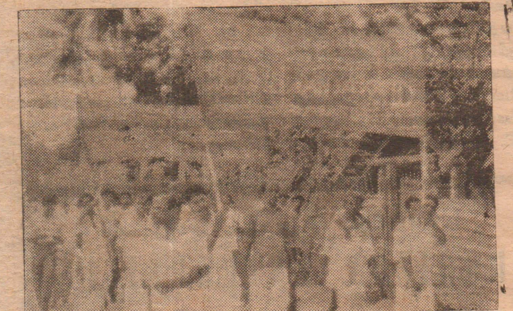
இலங்கை கபயூனிஸ்ட் கட்சி, கம்யூனிஸ்ட் கட்சி (இடது) நவசமசமாஜக் கட்சி ஆகியவைகளின் ஐக்கிய மேதின ஊர்வலம் நல்லூரில் புறப்பட்டு கொக்குவில் சென்றடைந்தது.

தமிழீழத்தை நோக்கி, பனிமலைகளில் மட்டுமல்ல பனைமரங்களின் கீழும் - பூக்கும் புரட்சி மலர்களே, மலையகப் பாட்டாளிகளின் விடிவு சுதந்திரத் தமிழீழத்தில் தான் போன்ற பல்வேறு கோஷங்கள் ஊர்வலத்தில் முன்வைக்கப்பட்டன. சிலோகங்கள் தமிழிலும், ஆங்கிலத்திலும் காணப்பட்டன.