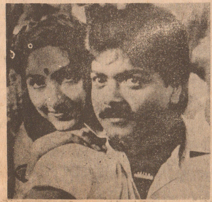
வேலியின்றி தோளில் தொற்றிக் கொண்டுமிருக்கும் கிளிக் தாவி பாக்கியம் கிடைத்த விட்ட மகிழ்ச்சியோ? (முரளி - ரோகினி) (படம்- சிலம்பு) (ரி-10)

என்னுடைய படங்களில் அடிதடி சண்டை நடனம் இருக்கிறது- ஆனால் எந்த ஒரு தனி மனிதனையோ சமூகநாயத் தையோ தவறான வழிக்குத் தூண்டுவதாக மட்டுமே இருக்காது! இப்படி அவர் தெரிவித்தார்- (ரி-11)