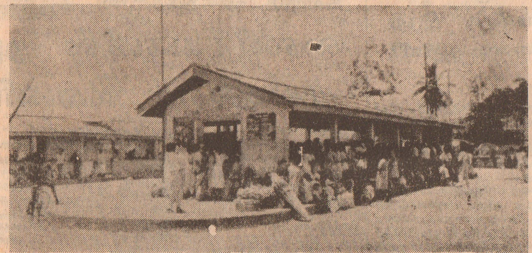
கல்முனை மாவட்டத்தில் பஸ்ஸுக்கு துவம்