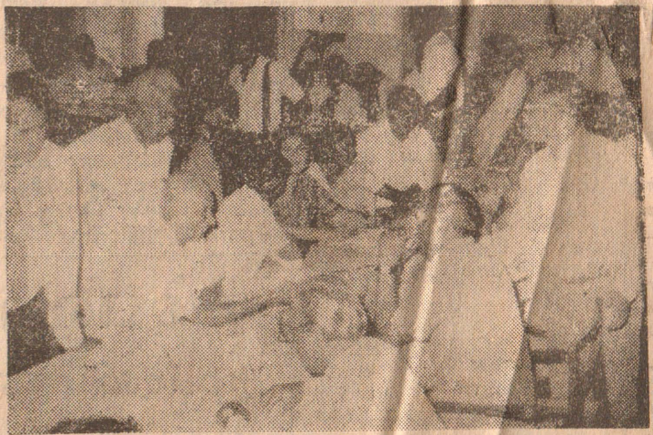
வந்திருக்க அமைச்சின் நடமாடும் சேவை