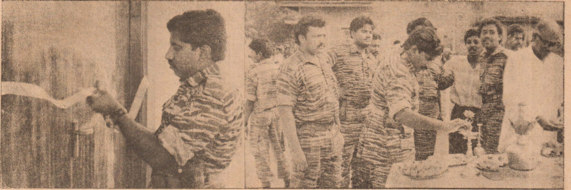
விடுதலைப்புலிகள் மக்கள் முன்னணியின் யாழ். மாவட்ட தலைமை அலுவலகத் திறப்பு விழா நேற்று முன்தினம் கோண்டாவிலில் நடைபெற்றது. தலைமை அலுவலகத்தை வைபவ ரீதியாக விடுதலைப்புலிகள் மக்கள் முன்னணித் தலைவர் மாத்தயா திறந்து வைப்பதை இங்கு காணலாம்.