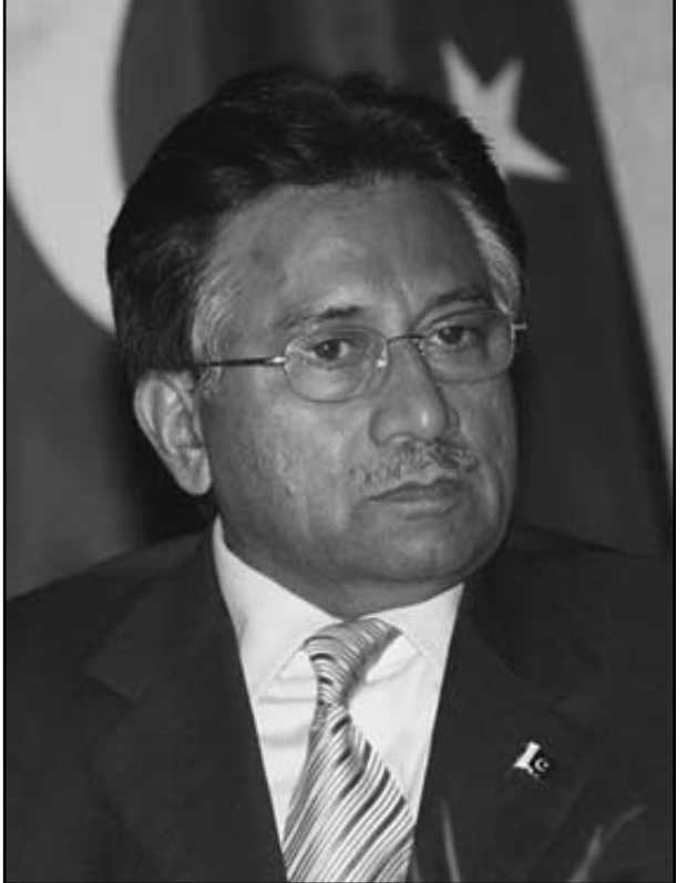
இதையும் முஸ்ராப் மறுத்துள்ளார். ஆனால் இந்த விவகாரம் பாகிஸ்தான் மீது அமெரிக்கா ஒரு நடவடிக்கையில் இறங்க வேண்டிய நிலைமையை ஏற்படுத்தலாம் என்ற கருதப்படுகின்றது.

அதே சமயம் பாகிஸ்தான் மறைமுகமாக தீவிரவாதிகளுக்கு ஆதரவு அளிக்கின்றது என்றும், பின்லாடன் பாகிஸ்தானில்தான் இருக்கின்றார் என்றும் அமெரிக்கா, பிரிட்டிஸ் அதிகாரிகளின் மட்டத்தில் இருந்து விமர்சனங்கள் வெளியாகியுள்ளன.