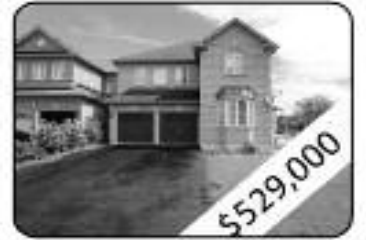
3 Bedrooms, 3 W Room Dining & Family Room With Gas Fireplace