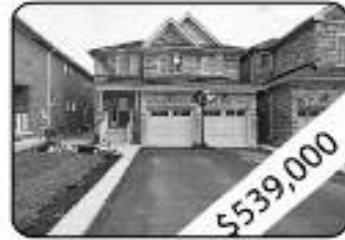
3 Bedrooms, 3 W Room California Shutters, Oak Staircase, Fire Place