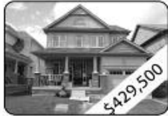
3 Bedrooms, 3 W Room Open Concept Main Flr & Fam Rm W/ W/O To Yard