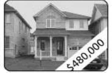
3 Bedrooms, 3 W Room Bright And Sun-Filled Home Open Concept Kitchen