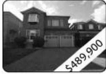
4 Bedrooms, 3 W Room Large Detached Fully Bricked Double Car Garage