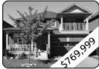
4 Bedrooms, 3 W Room Master Bdrm Has An Amazing 4Pc Ensuite & Walk-In Closet