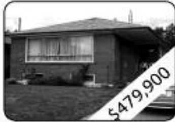
3+2 Bedrooms, 2 W Room Potential Basement Apartment Lots Of Parking