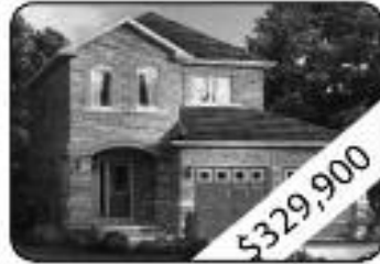
3 Bedrooms, 3 W Room Large Master Bedroom With Sumptuous Ensuite Bath