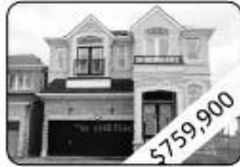
4+1 Bedrooms, 4 W Room Professionally Finished Basement With Huge Bedroom