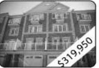
3 Bedrooms, 2 W Room 2 Year New "Sierra" Built Royal Wynd Home