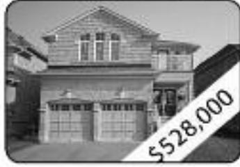
4+2 Bedrooms, 4 W Room Large Dining Rm W/ Decorative Columns For Entertaining