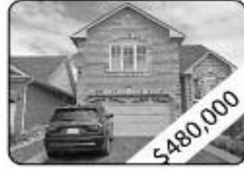
3+1 Bedrooms, 2 W Room Professionally Landscaped Including Stamped Concrete