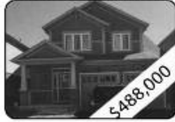
3 Bedrooms, 3 W Room Upgraded Oak Staircase With Iron Picket Rails