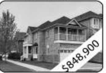
3 Bedrooms, 4 W Room Beautiful Hardwood On Main Floor Walk-Out To Balcony