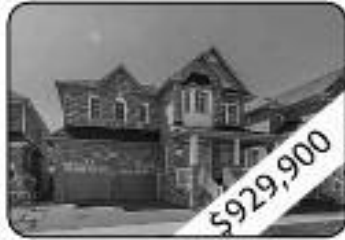
4 Bedrooms, 4 W Room Upgraded Kitchen Cabinets, Backsplash, Granite Counter Top & Centre Island