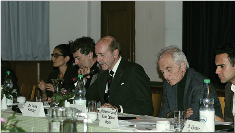
The Peoples' Tribunal on Sri Lanka