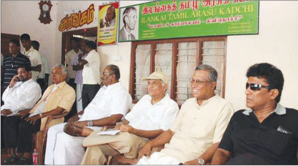
கோபி ஒரு பேப்பர்

கடந்த ஒரு பேப்பர் இல் இப்பத்தி சிறிலங்காவின் அதிபர் தேர்தல் பற்றியதாகவே எழுதப்பட்டது. இம் முறையும் அது தொடர்பாகவே எழுதப்படுகிறது. இலங்கைத் தீவு தொடர்பான நடப்பு அரசியல் அடுத்த வருட முற்பகுதியில் நடைபெறவிருப்பதாக எதிர்பார்க்கப்படுகின்ற இத்தேர்தல் பற்றியதாக அமைந்திருக்கிறது. அரசியல் கட்சிகளினதும், அதன் தலைவர்களின் நடவடிக்கைகளும் இத்தேர்தலை ஓட்டியதாகவே அமைந்திருப்பதனை அவதானிக்க முடிகிறது.