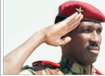
கப்டன் தோமஸ் சங்கரா ஆபிரிக்காவின் சே குவாரா (டிசம்பர் 21, 1949 - அக்டோபர் 15, 1987)

ஒகஸ்ட் 4, 1983 ஒரு இராணுவ புரட்சியின் மூலம் தனது 33 வது வயதில் மேற்கு ஆபிரிக்க நாடான அப்பர் வோல்டாவின் ஆட்சியை கைபற்றினார். பதவிக் காக, எதிர்காலத்தில் தேசத்தை காட்டிக்கொடுக்கபோகும் தனது நண்பர்களின் அலையே சுட்டுக்கொல்லப்படும் வரை (அக்டோபர் 15, 1987) 4 ஆண்டுகள் 2 மாதம் 12 நாட்கள் ஆட்சிப்பொறுப்பில் இருந்தார். இந்தக் குறுகிய காலத்தில் அவர் செய்தவை