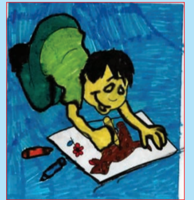
Vigashan - Rehasan