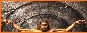
சூரியாவுக்கும் திரிஷாவுக்கும் இதுவா?