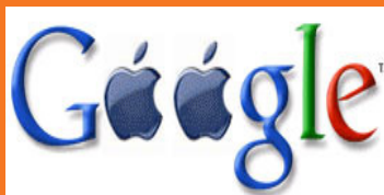
கூகிள் அப்பிள் லடாய்