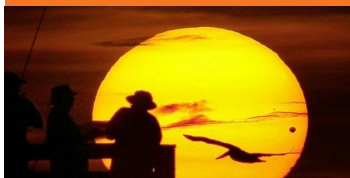
சூரியனை மறைத்த வீனஸ்