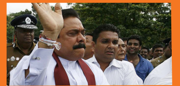
மகிந்தர் பிடரியில் கால்பட ஓட்டம்!