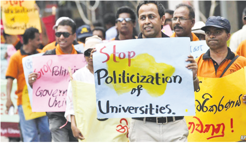
பல்கலைக்கழக விரிவுரையாளர்கள் பல்வேறு கோரிக்கைகளை முன்வைத்து நடாத்தி வரும் வேலைநிறுத்தப் போராட்டத்தில்...

தேர்தலை நடாத்துமாறு பாராளுமன்றத்தில் கோரிக்கை!